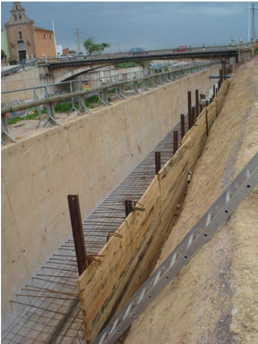
Ejecución bandeja en trasdós de muro