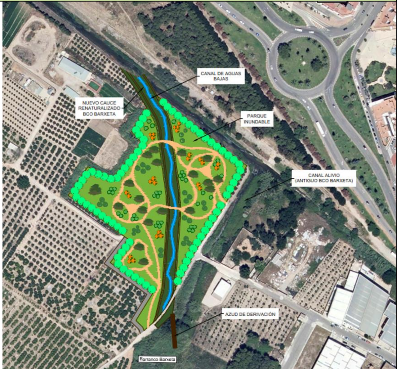
Planta de zona de laminación propuesta