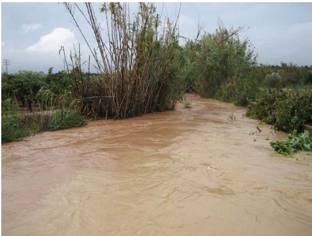
Situación después de la actuación