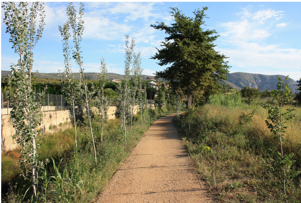
Estado del mismo tramo de la senda con los trabajos ya avanzados.