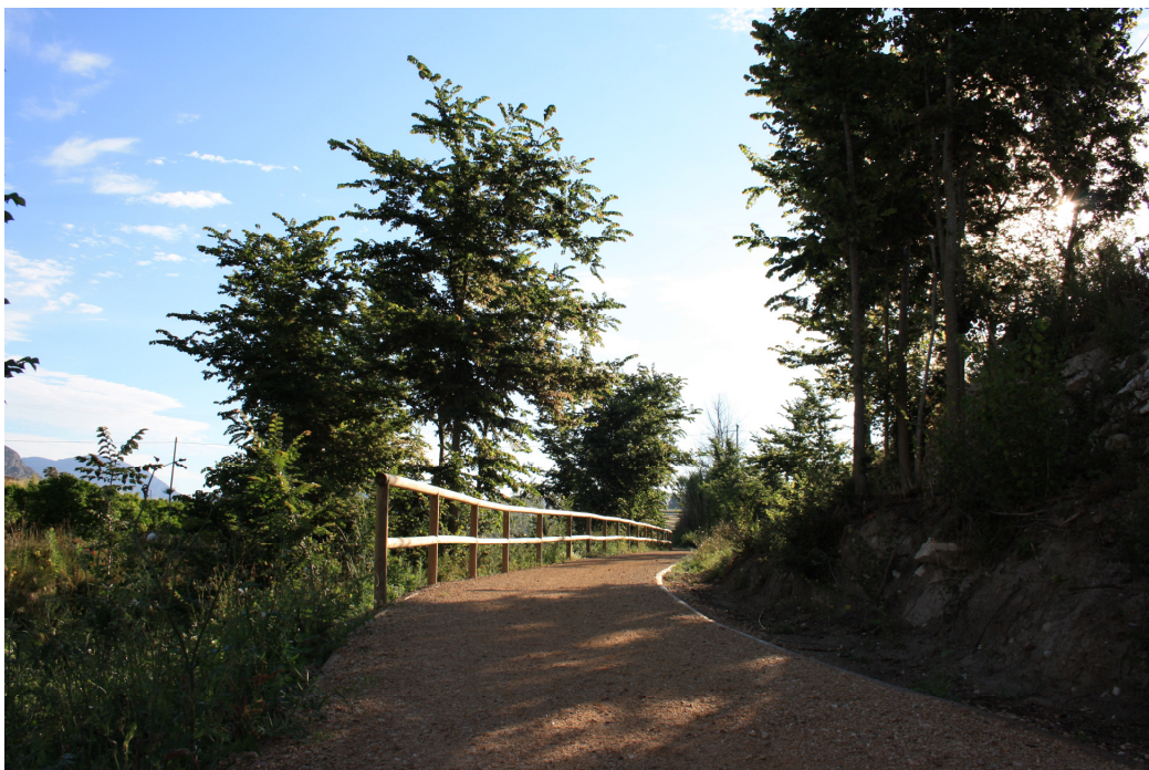
Tramo de senda ya finalizado.