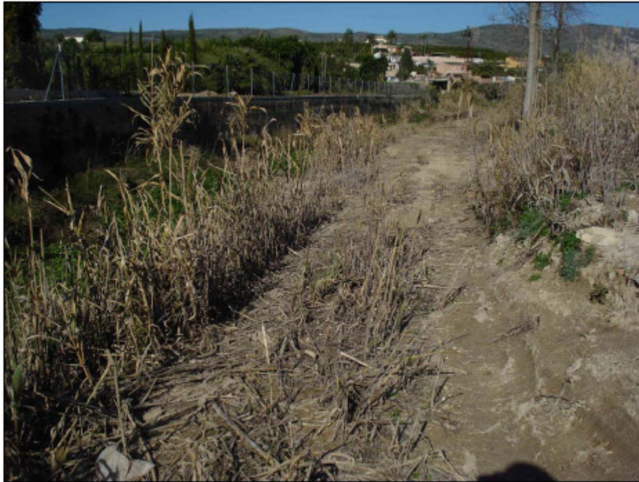
Estado de la senda junto al barranco al inicio de las obras.