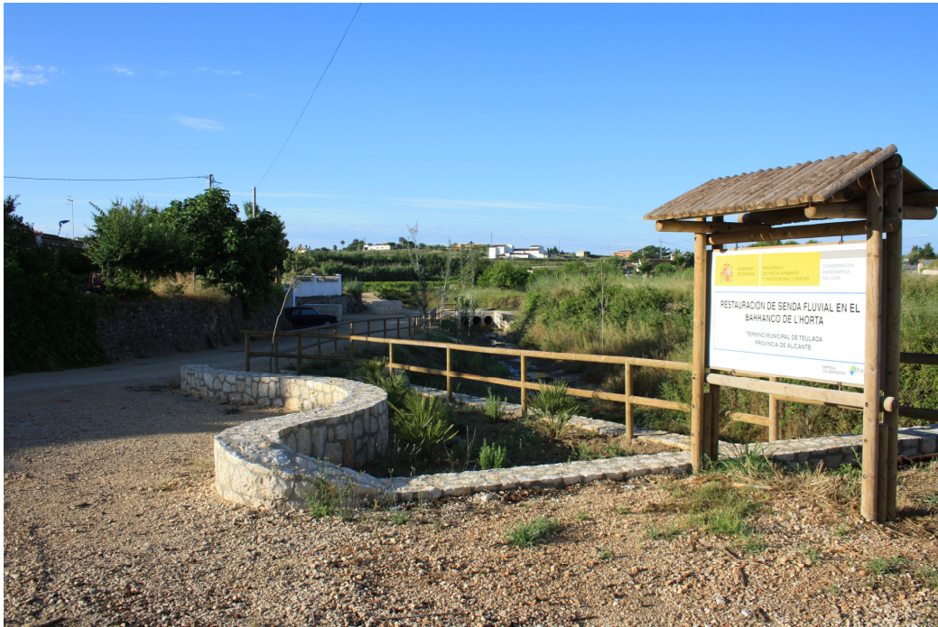
Cartel indicativo al inicio de la actuación.