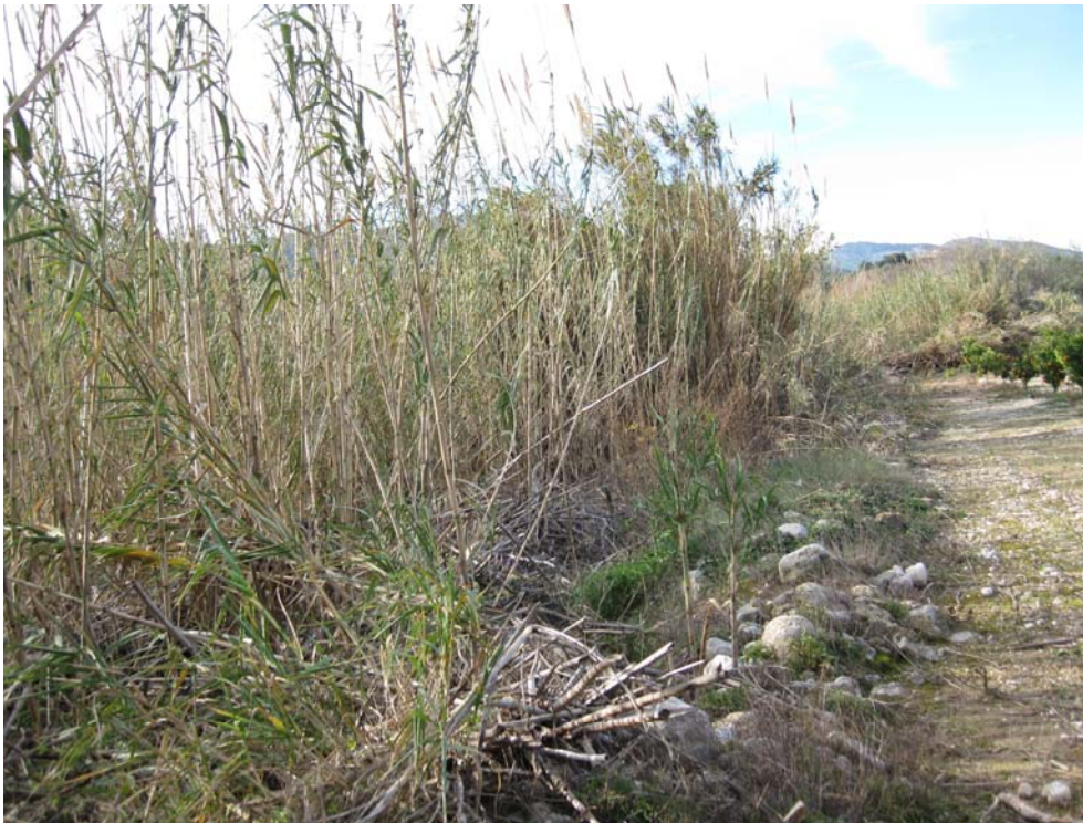
Vista general del estado del cauce del barranco antes de actuar.