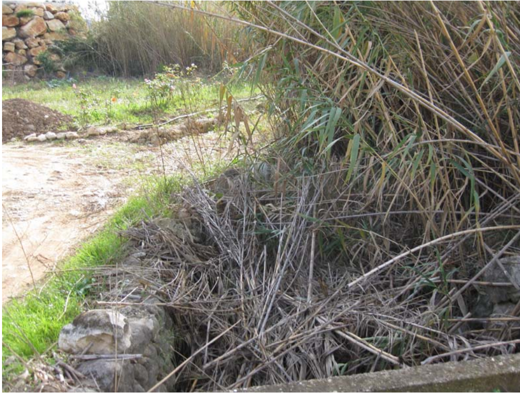
Detalle de uno de los puntos del cauce totalmente obstruido, antes de actuar.