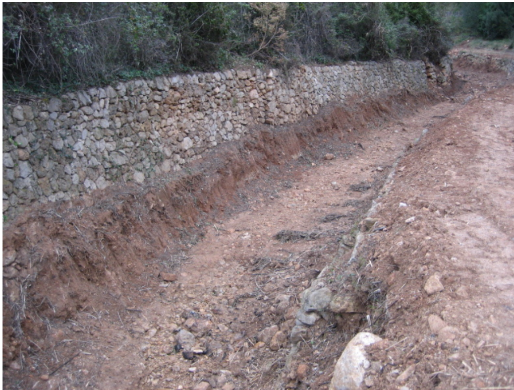
Vista general del estado del cauce del barranco tras la actuación.