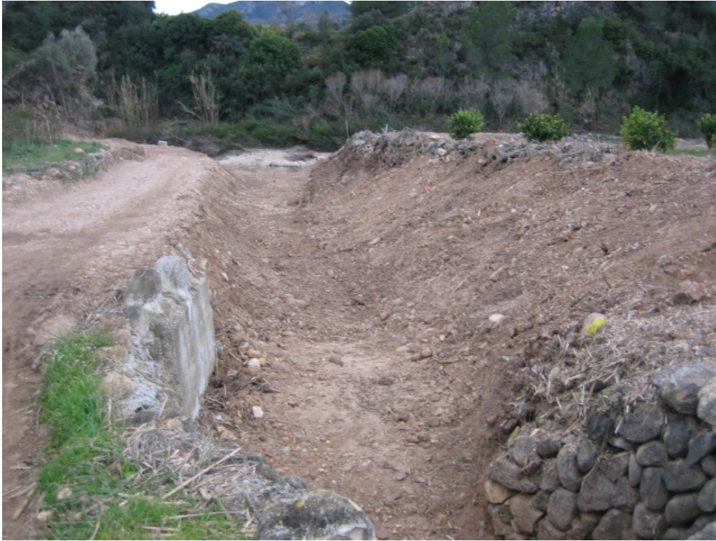
Aspecto final del barranco en la zona de confluencia con el río Gorgos.