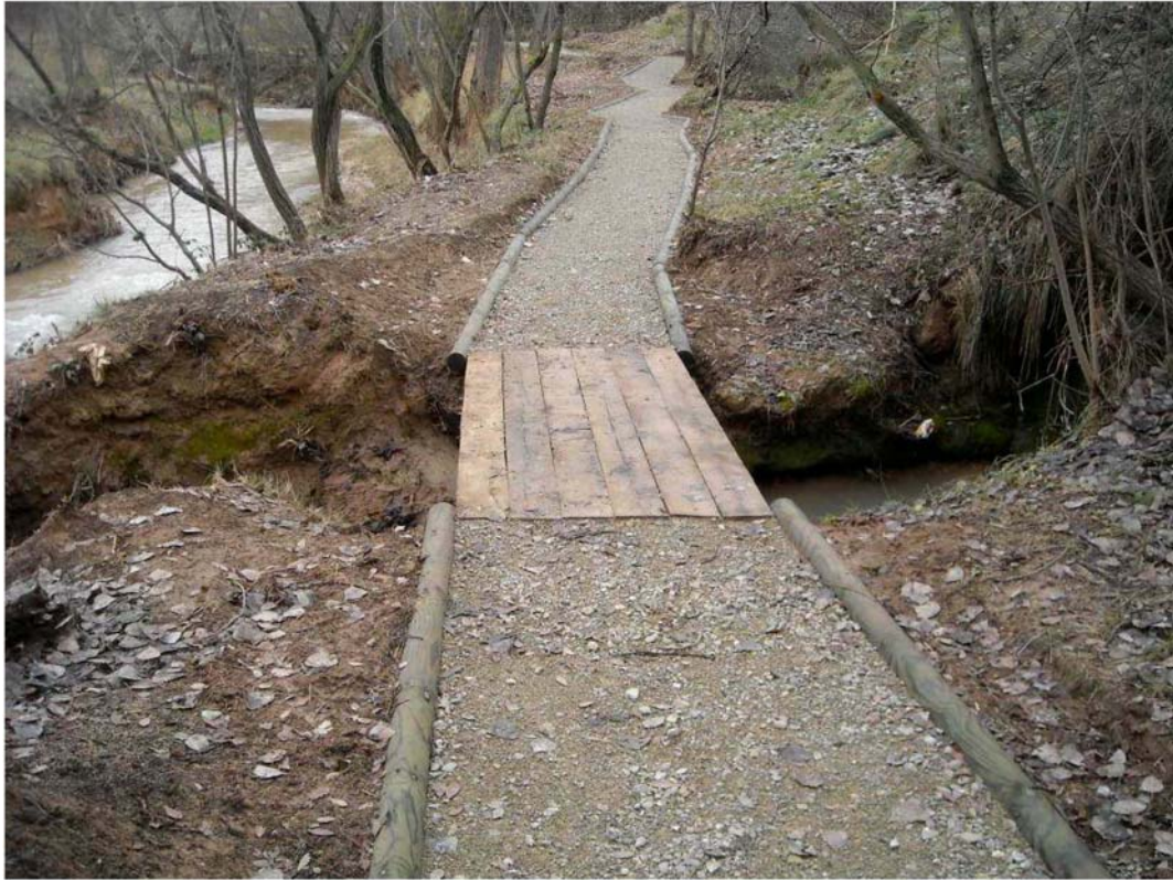
Senda tramo 7. Paso salvaacequia