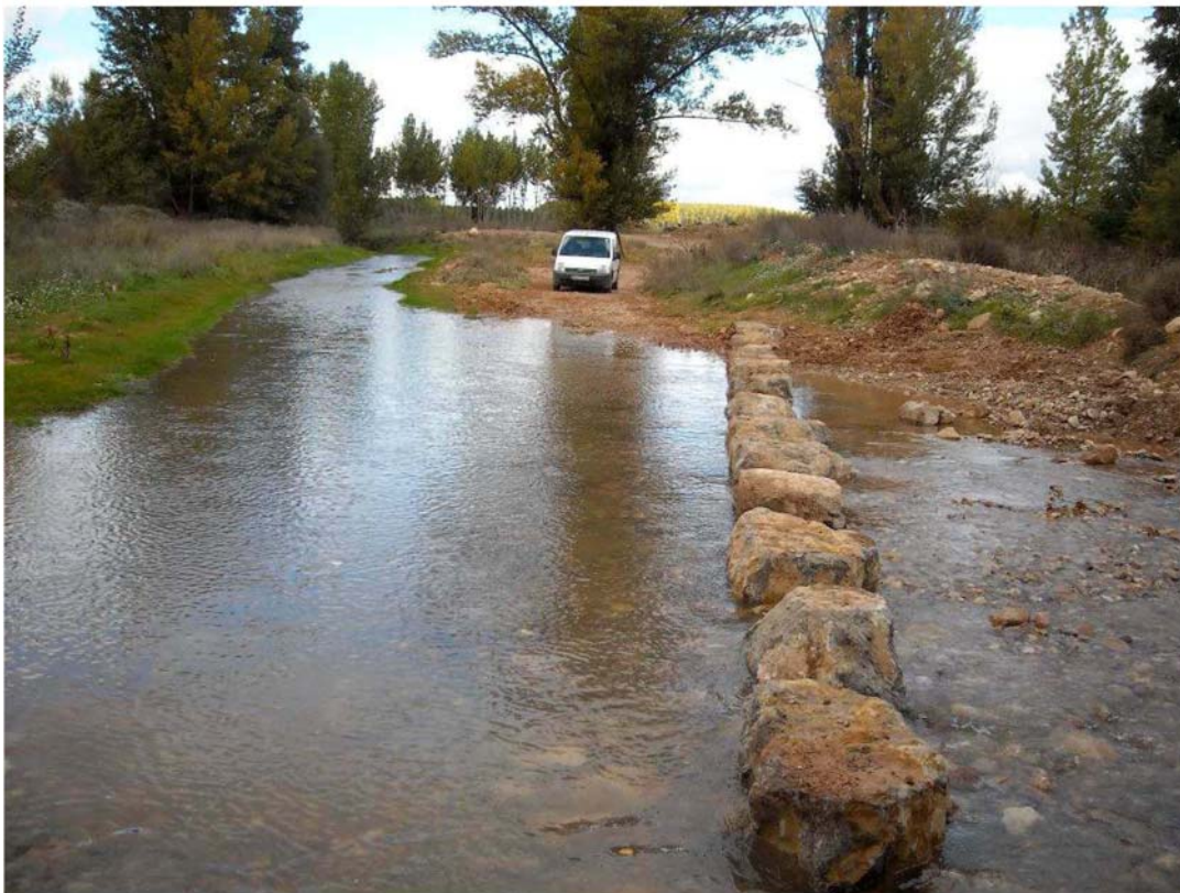
Paso de pisas