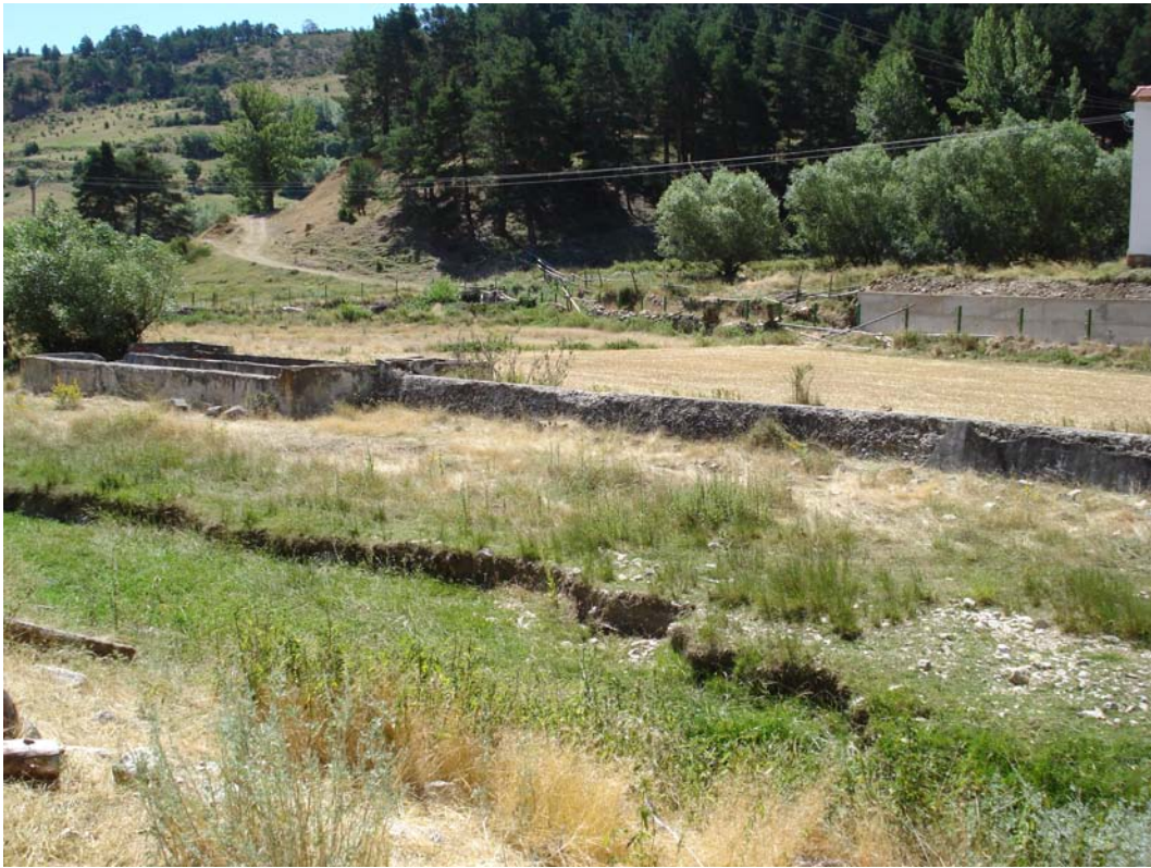
Situación después de la actuación