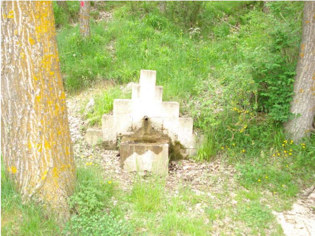
Situación después de la actuación