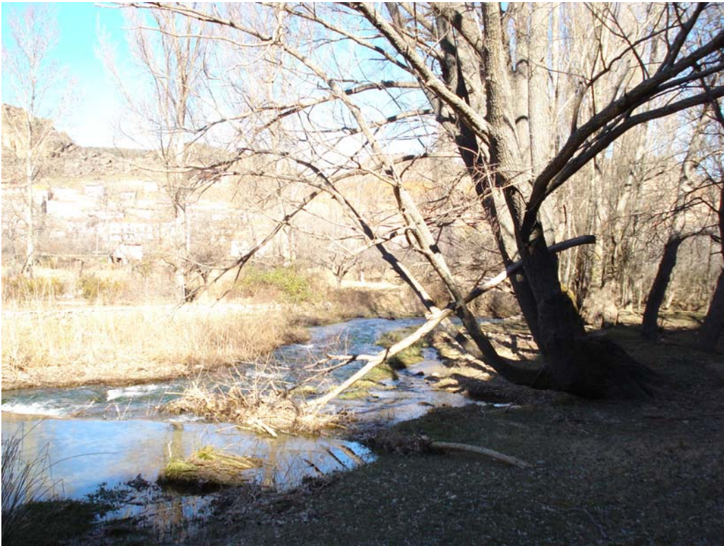
Situación después de la actuación