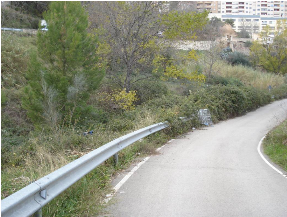
Aspecto de un tramo del cauce antes de los trabajos.