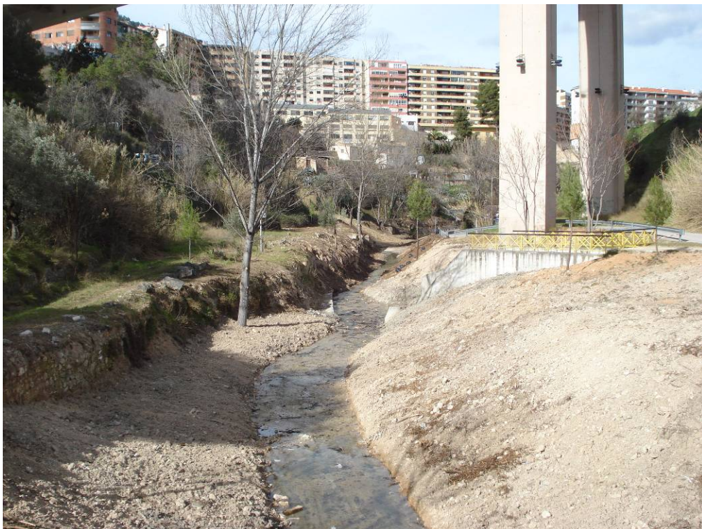
Aspecto del mismo tramo de cauce tras los trabajos.