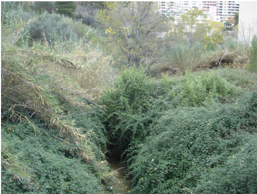
Aspecto de un tramo del cauce antes de los trabajos.