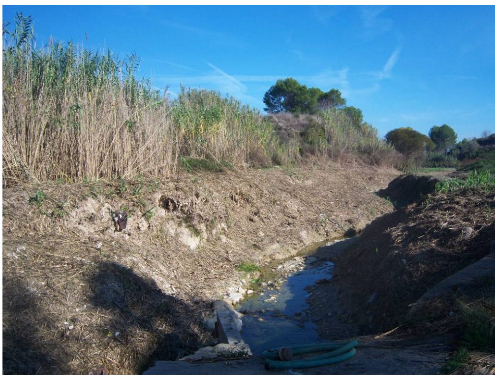
Vista del estado del cañar en el mismo tramo, tras la actuación.