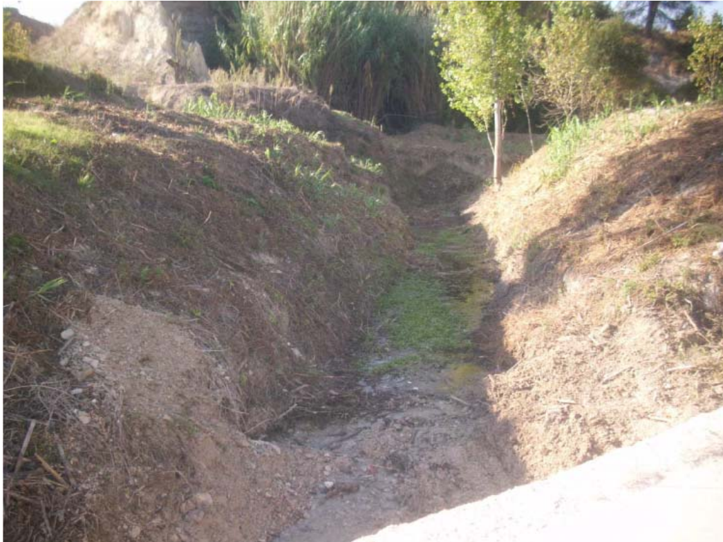
Vista del estado de la vegetación de ribera en el mismo tramo, tras la actuación.