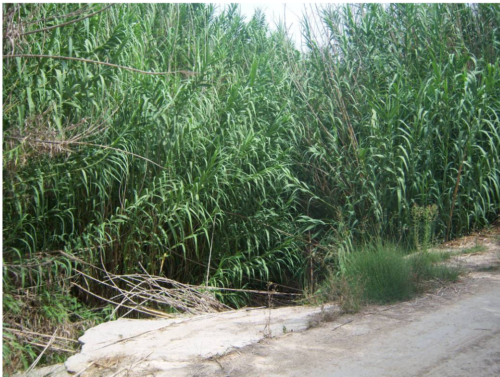
Vista del estado del cañar en un tramo del barranco, antes de la actuación.