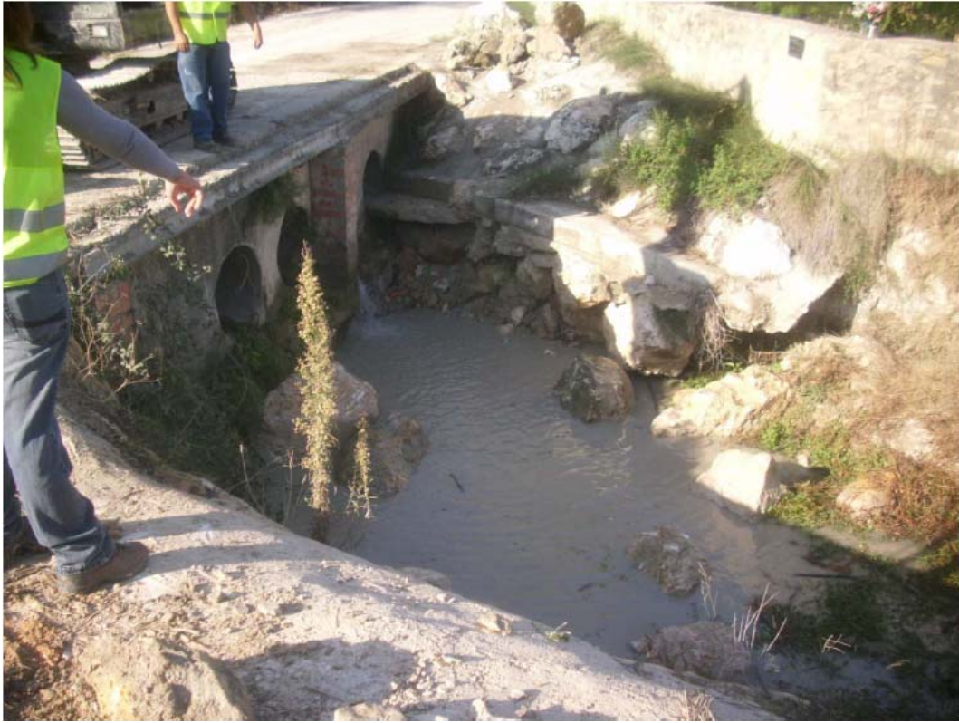
Vista de la erosión localizada existente aguas abajo del badén, antes de la actuación.