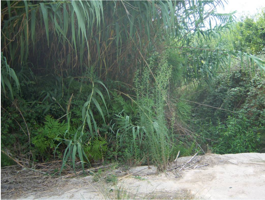
Vista del estado de la vegetación de ribera en un tramo del barranco, antes de la actuación.