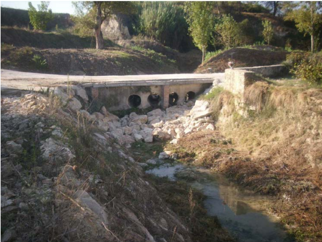
Vista de la protección puntual con escolleras de la erosión, tras la actuación.