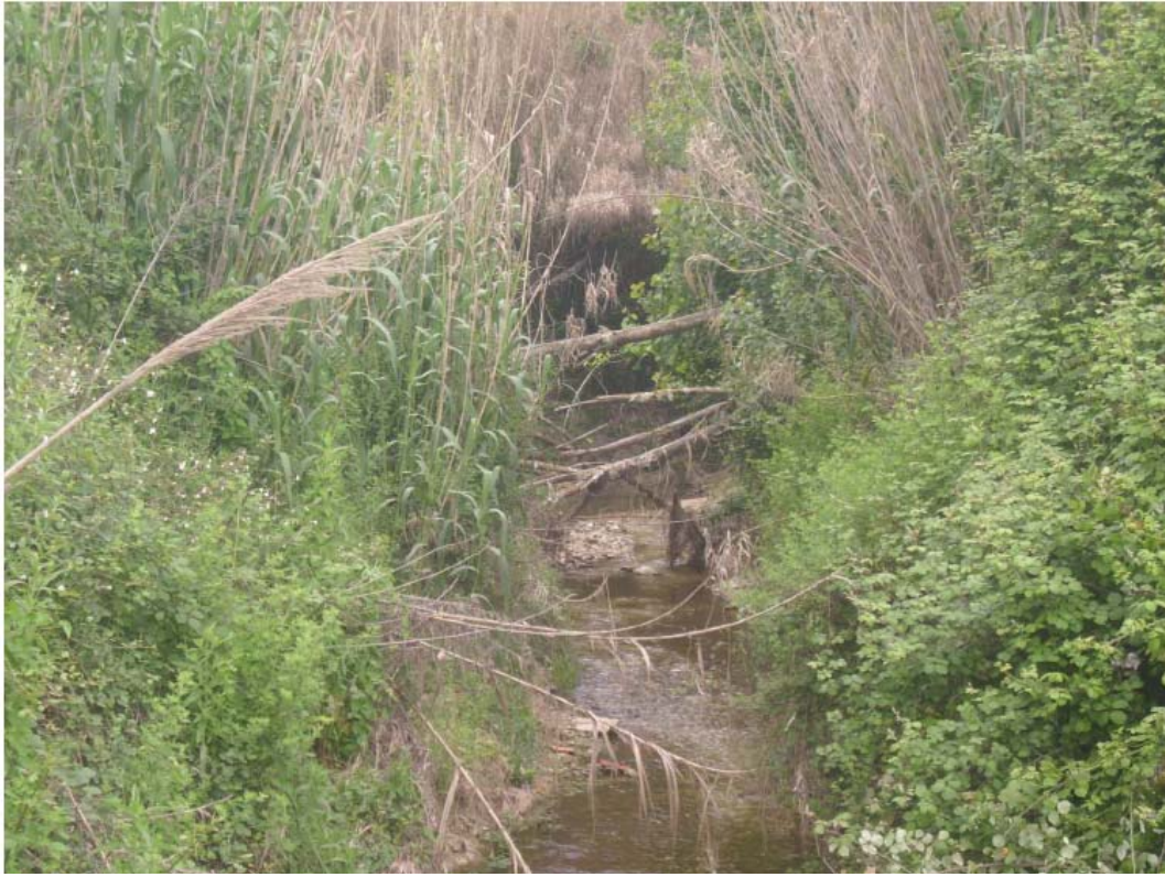
Vista del estado de la vegetación de ribera en un tramo del barranco, antes de la actuación.