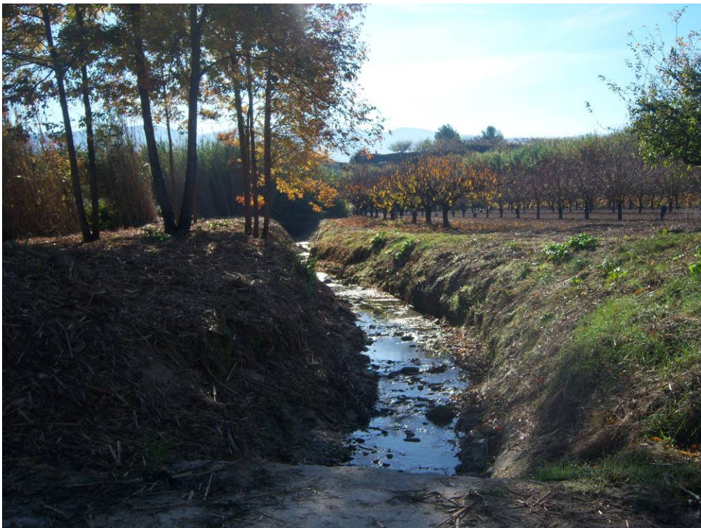
Vista del estado de la vegetación de ribera en el mismo tramo, tras la actuación.