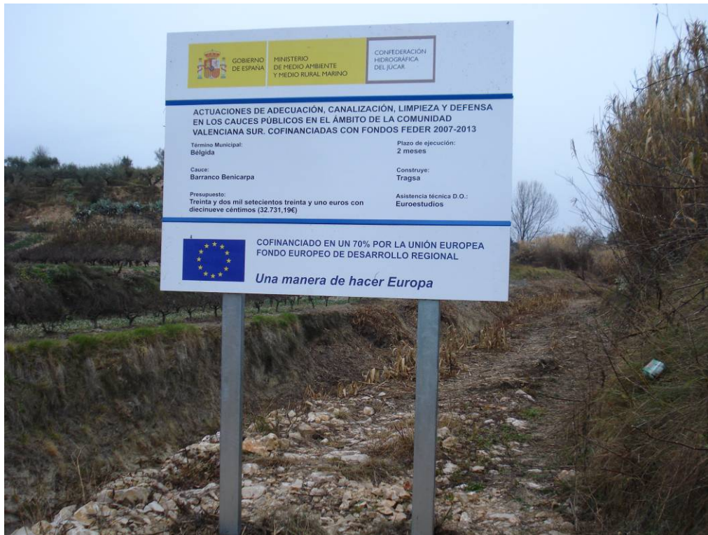
Vista de la protección puntual con escolleras de la erosión, tras la actuación.