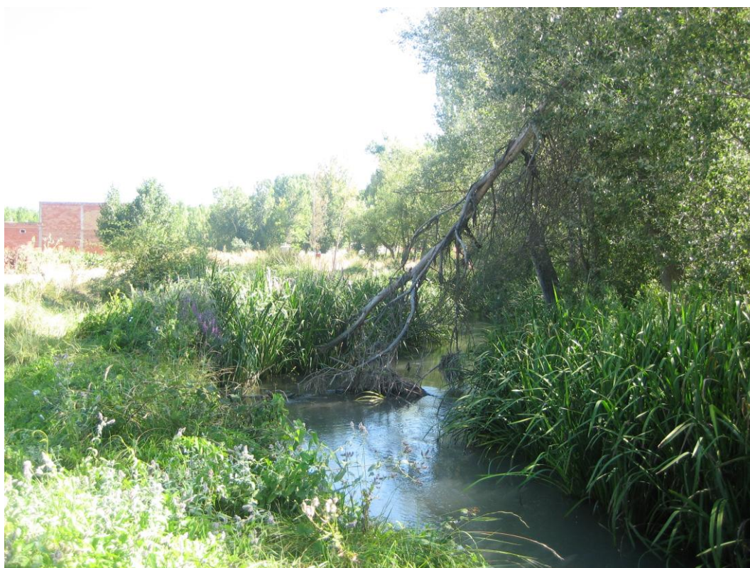
Después de la actuación