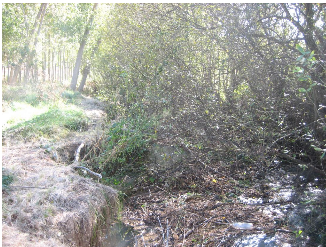
Después de la actuación