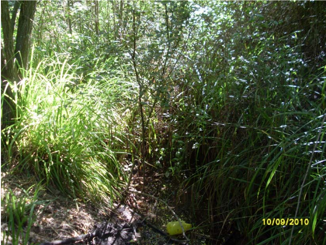
Situación después de la actuación