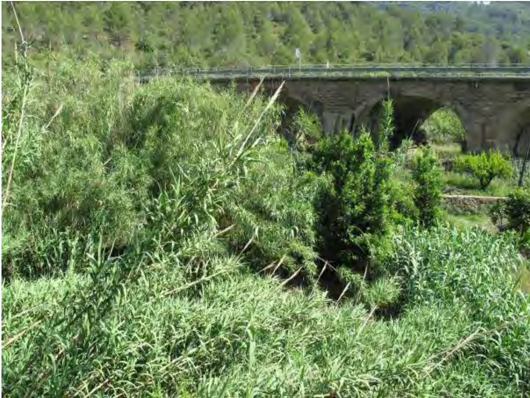
Situación después de la actuación