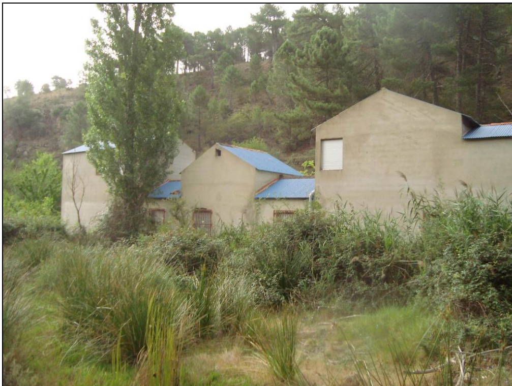
Situación después de la actuación