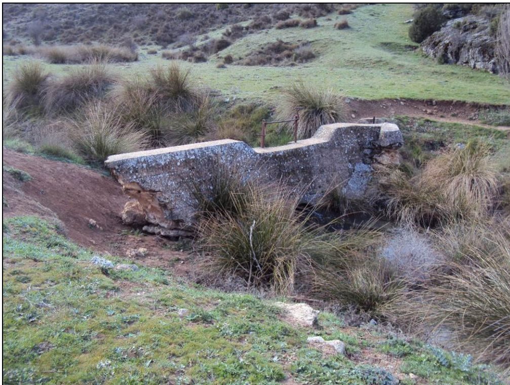
Situación después de la actuación