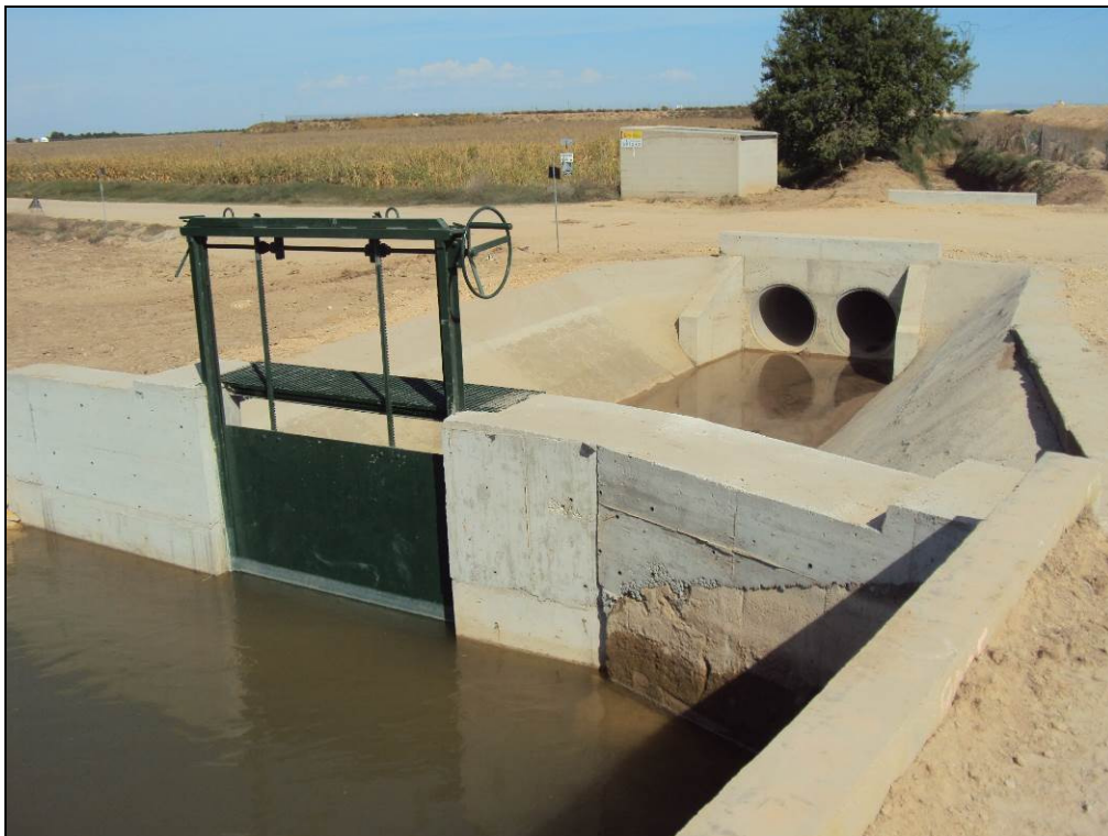
Situación después de la actuación