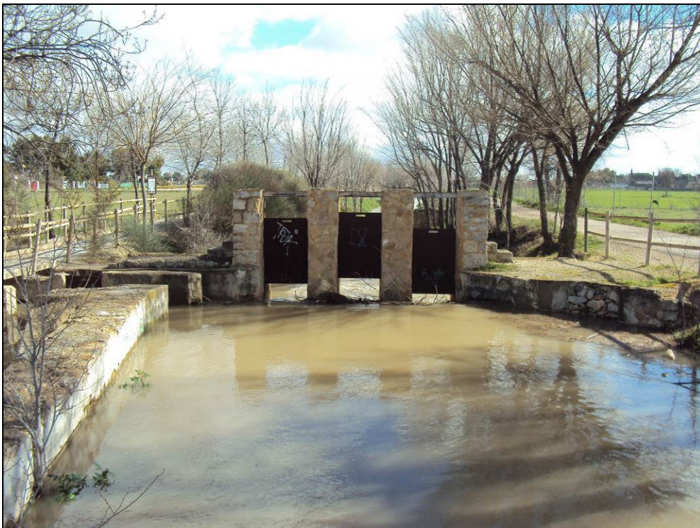
Situación después de la actuación