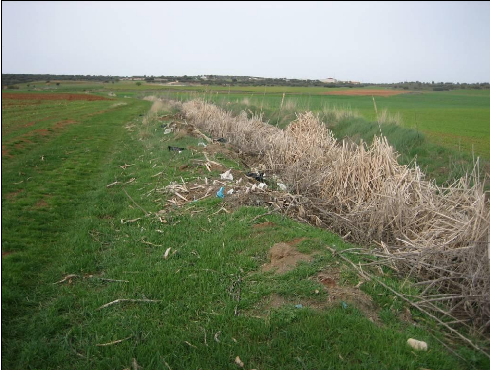
Situación después de la actuación