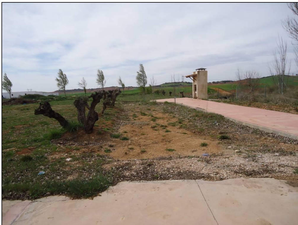
Situación después de la actuación