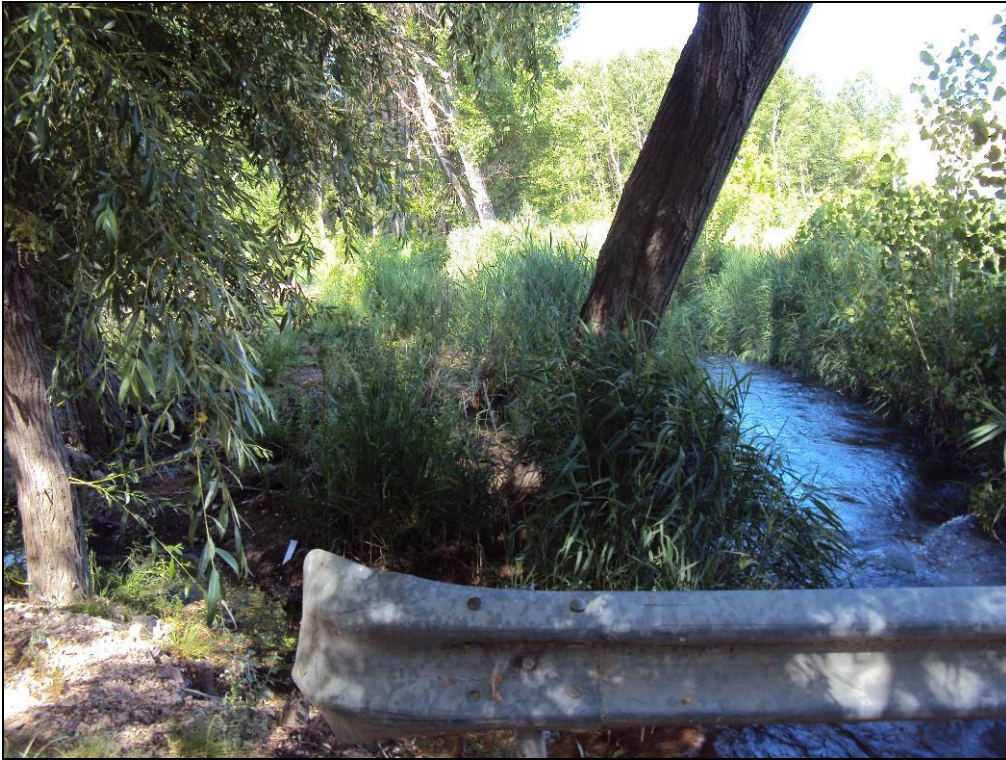
Situación después de la actuación