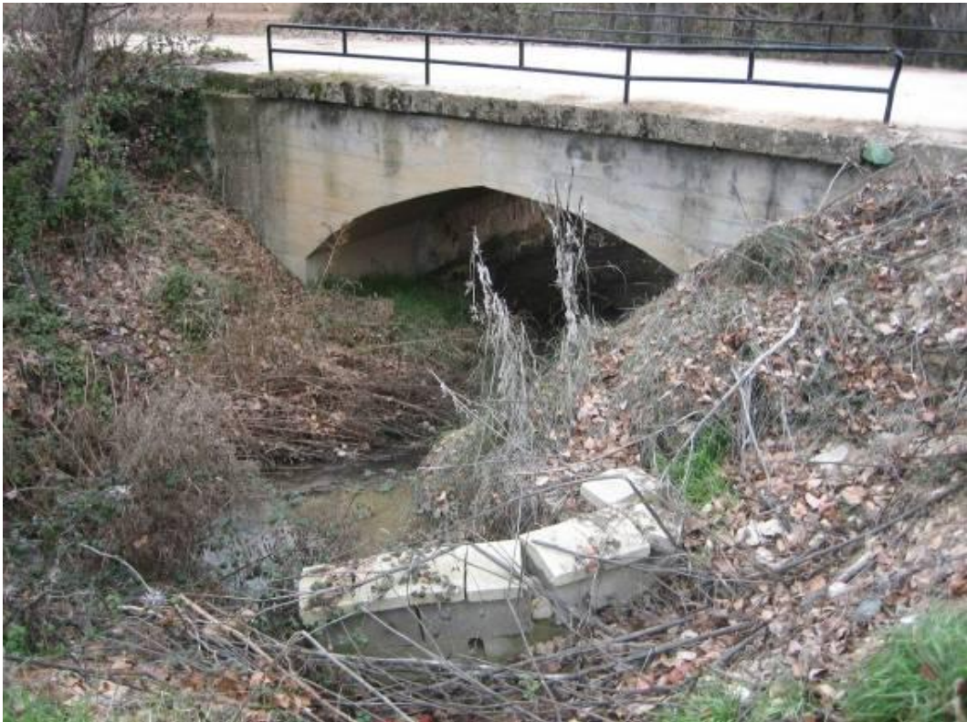
Situación después de la actuación