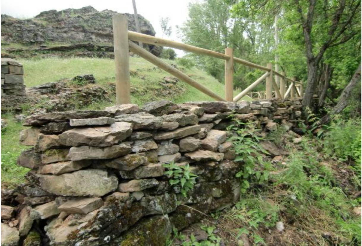
Detalle de los muros reconstruidos (III)