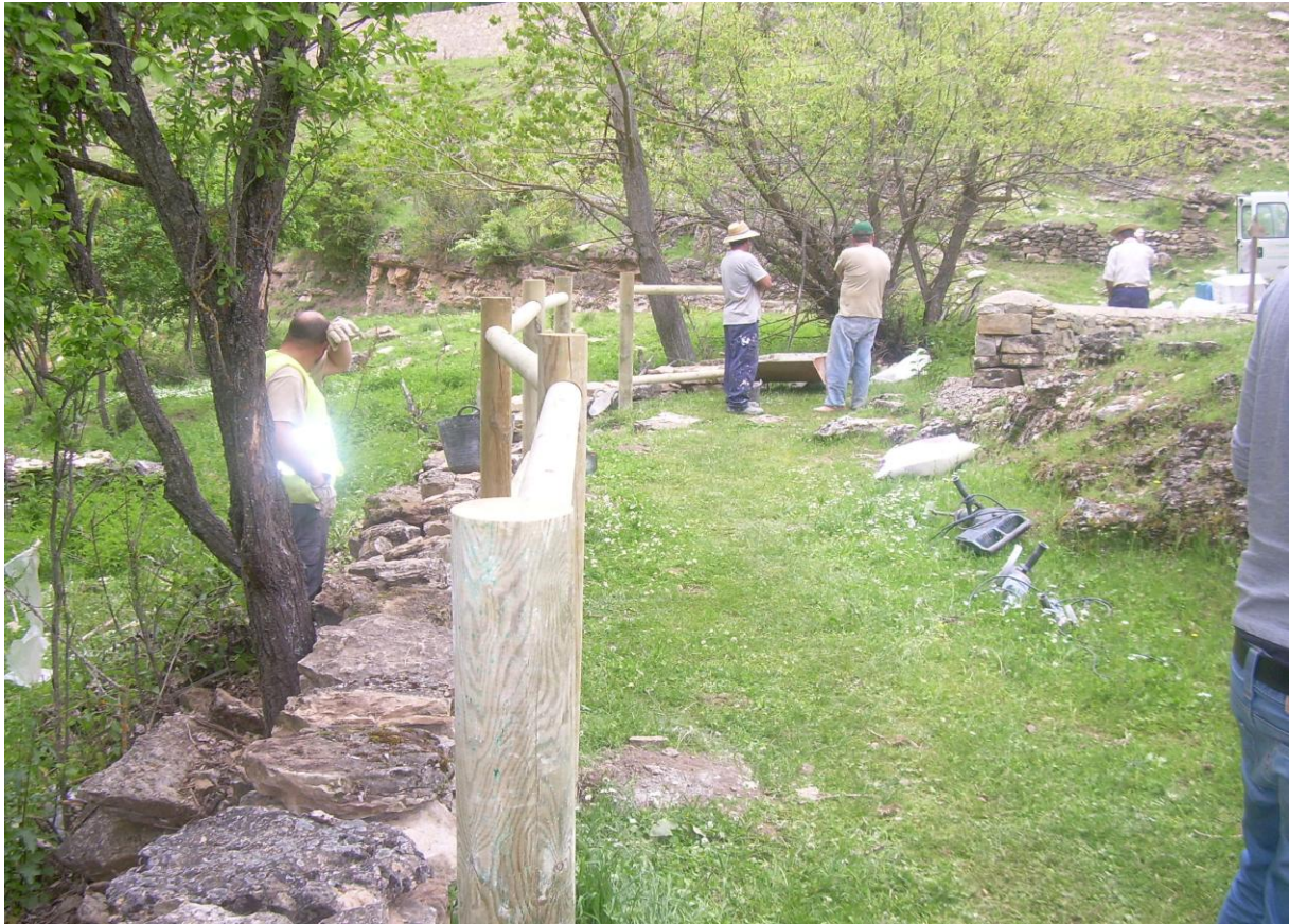
Durante la ejecución de los trabajos (III)