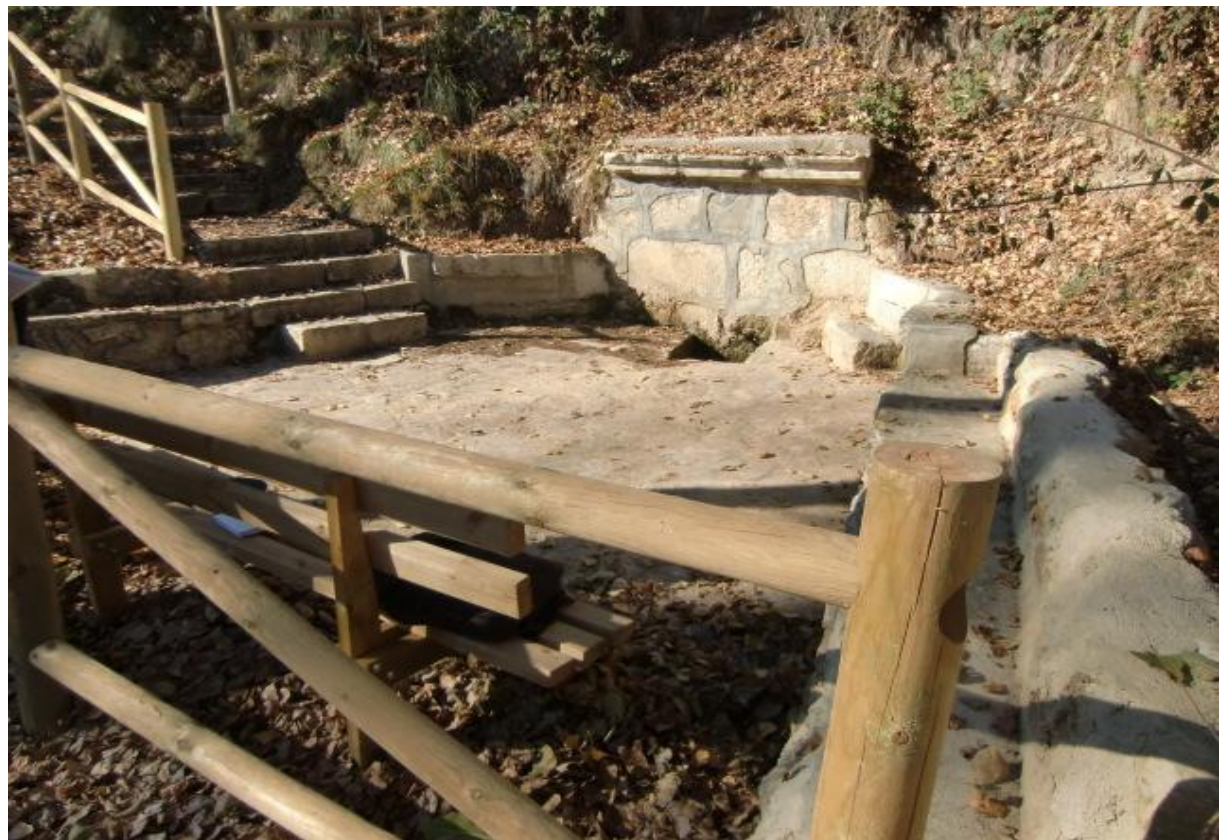
Antes de la actuación