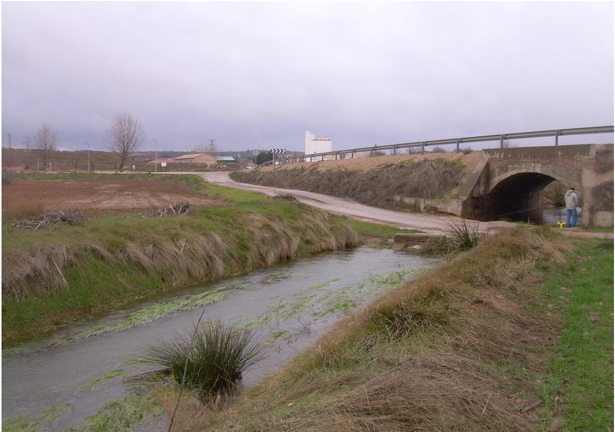
Situación después de la limpieza mecanizada del cauce