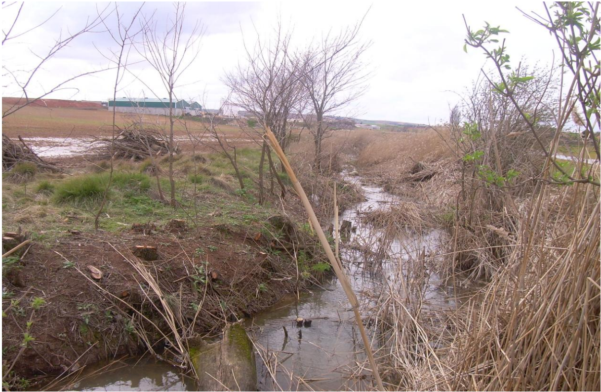
Situación después de la limpieza mecanizada del cauce