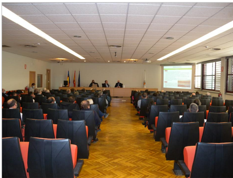
Figura 5. Instantánea de la presentación

Arancha Fidalgo recordó que en la página web se puede consultar las diferentes actividades relacionadas con la participación pública y terminó la presentación explicando el calendario con la celebración de las distintas mesas territoriales que se han llevado a cabo y aportando diferentes cuestiones para abrir el debate de la siguiente parte de la reunión.