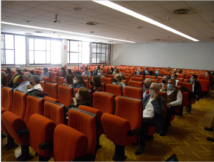
Figura 6. Instantánea del debate