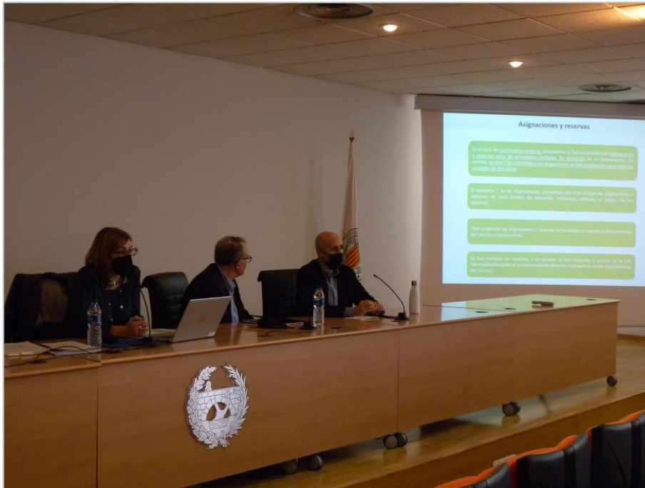
Figura 2. Presentación de la jornada

jefa de la Oficina de Planificación Hidrológica, y resaltó que la parte más interesante sería la de intervención directa de los asistentes, animando a su participación.