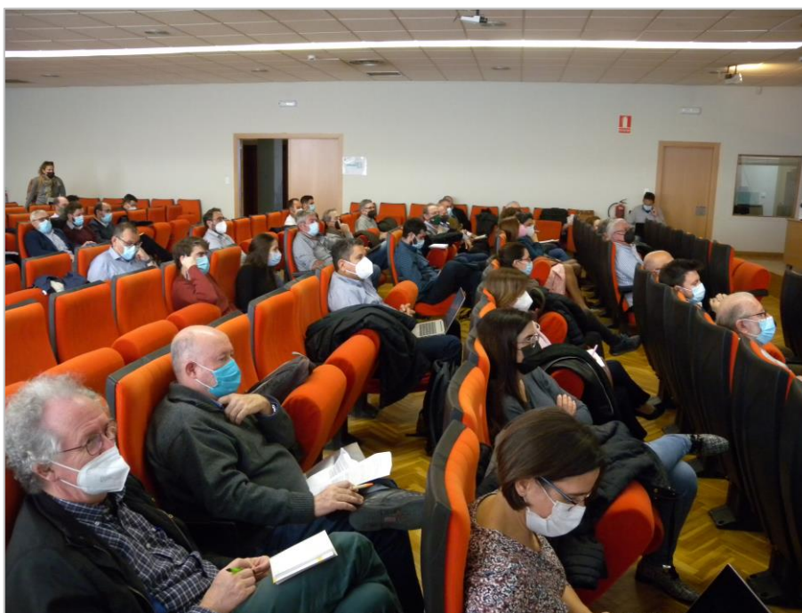
Figura 1. Asistentes a la mesa territorial