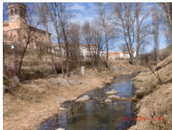
Después de la actuación.