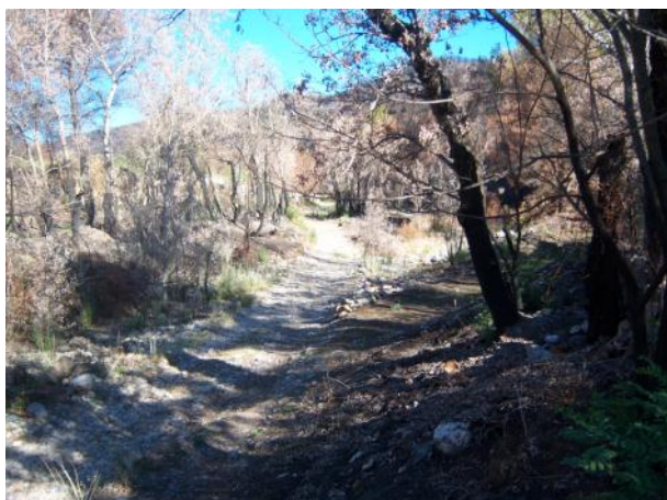
Antes de la actuación.

Eliminación de la vegetación arbórea y arbustiva quemada y en mejora de las cualidades ecológicas de la zona y su entorno