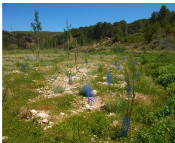
Estado de las plantaciones cerca del embalse de Forata