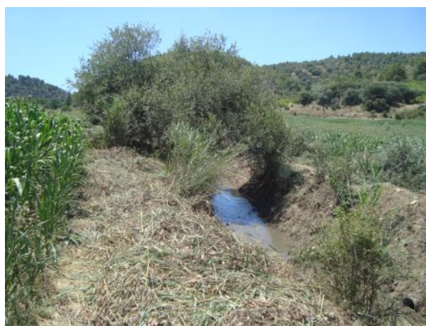
Después de la actuación.