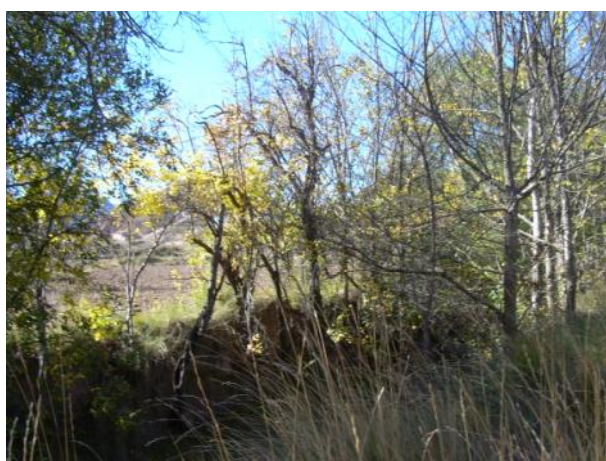
Antes de la actuación.

Limpieza, podas y clareos sobre los pies enfermos, muertos o malformados y desbroce selectivo para la recuperación de la capacidad de desagüe.