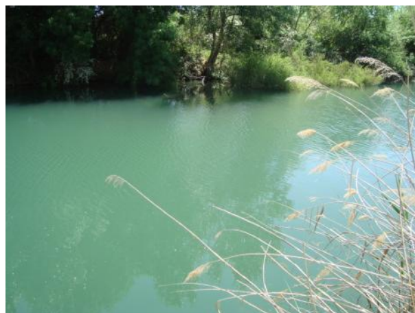
Después de la actuación.