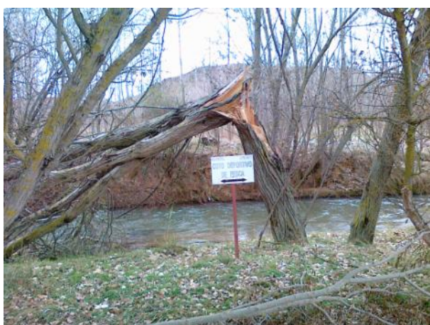
Antes de la actuación.

Limpieza, podas y clareos sobre los pies enfermos, muertos o malformados y desbroce selectivo para la recuperación de la capacidad de desagüe.