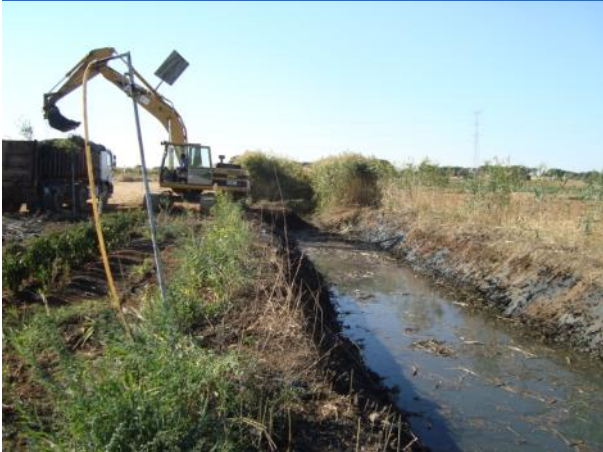
Durante la actuación.