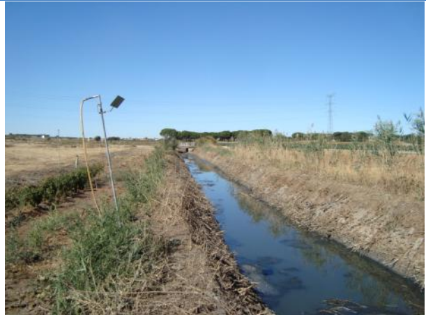
Después de la actuación.