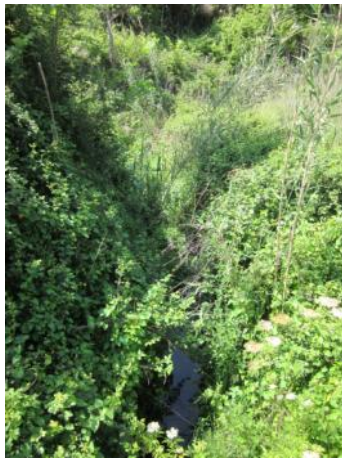
Antes de la actuación.

Desbroce selectivo de la vegetación para la recuperación de la capacidad hidráulica.