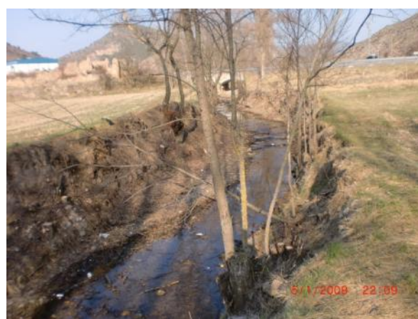
Después de la actuación.