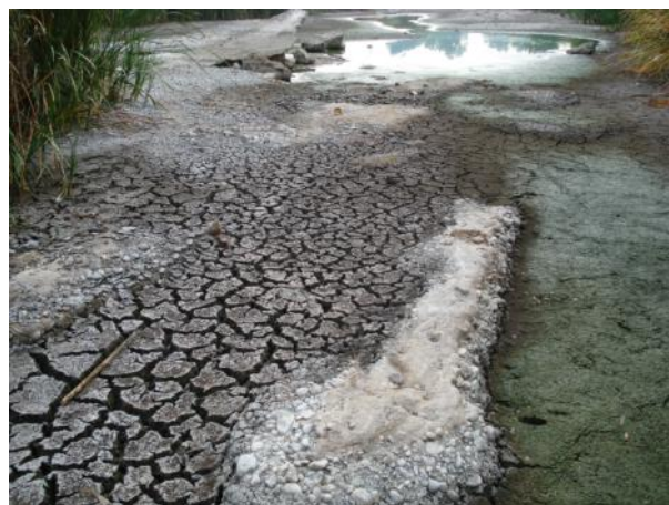
Después de la actuación.