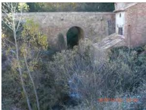
Antes de la actuación.

Limpieza, podas y clareos sobre los pies enfermos, muertos o malformados y desbroce selectivo para la recuperación de la capacidad de desagüe.