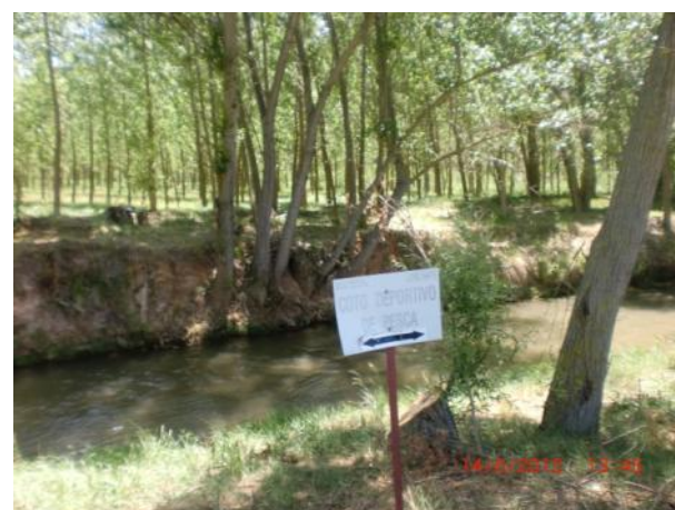
Después de la actuación.