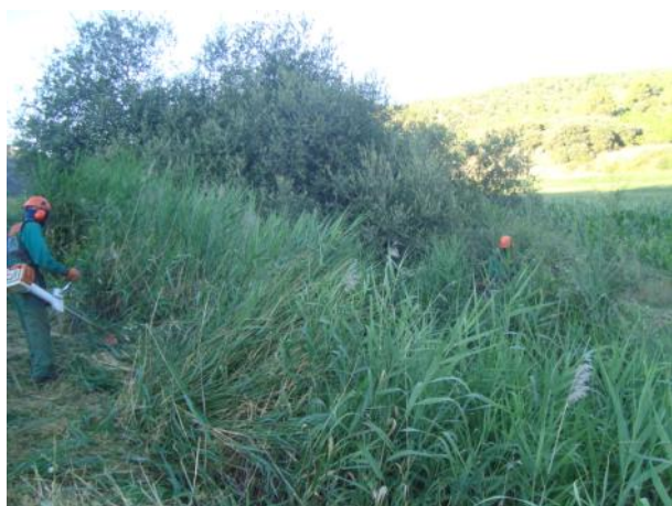
Antes de la actuación.