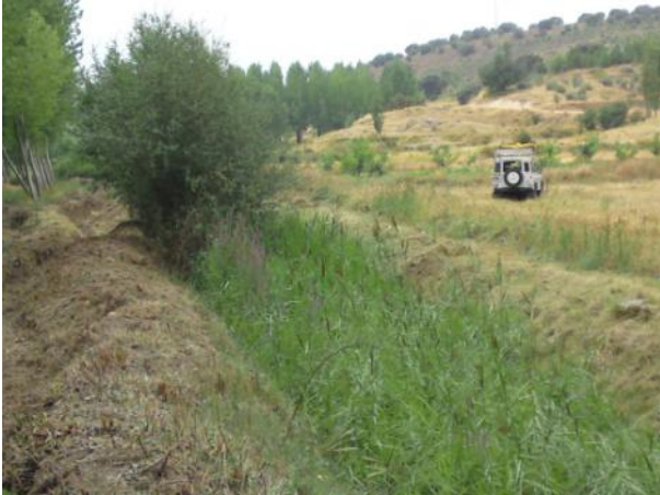
Antes de la actuación.