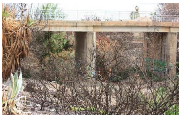
Antes de la actuación.

Eliminación de la vegetación arbórea y arbustiva quemada y en mejora de las cualidades ecológicas de la zona y su entorno