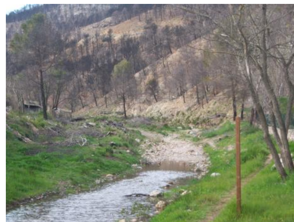
Después de la actuación.