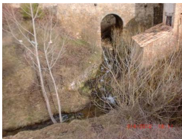
Después de la actuación.