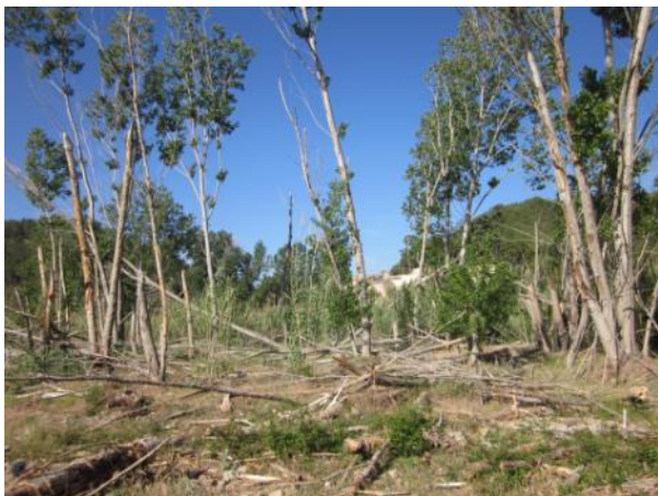
Antes de la actuación.