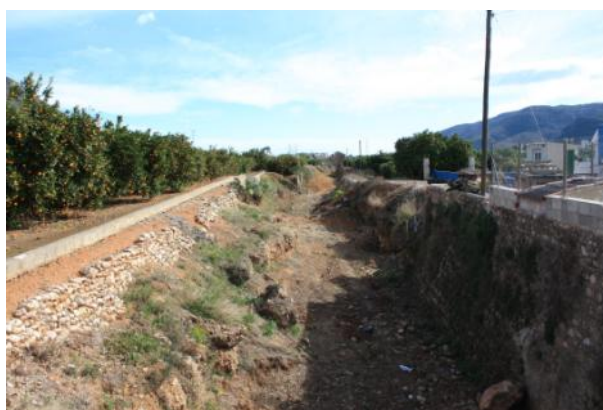
Después de la actuación.