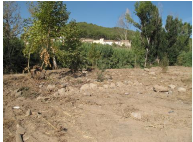
Después de la actuación.