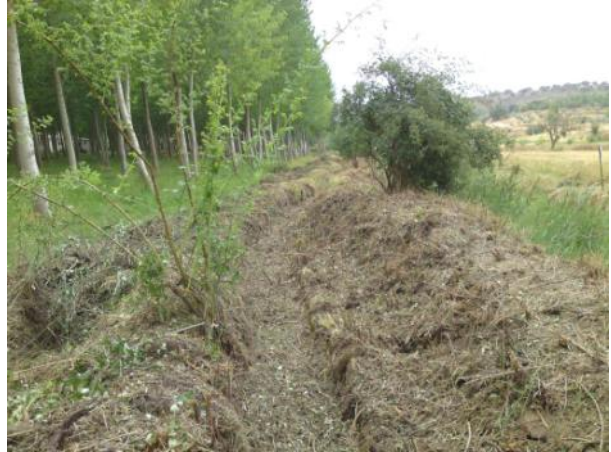
Después de la actuación.