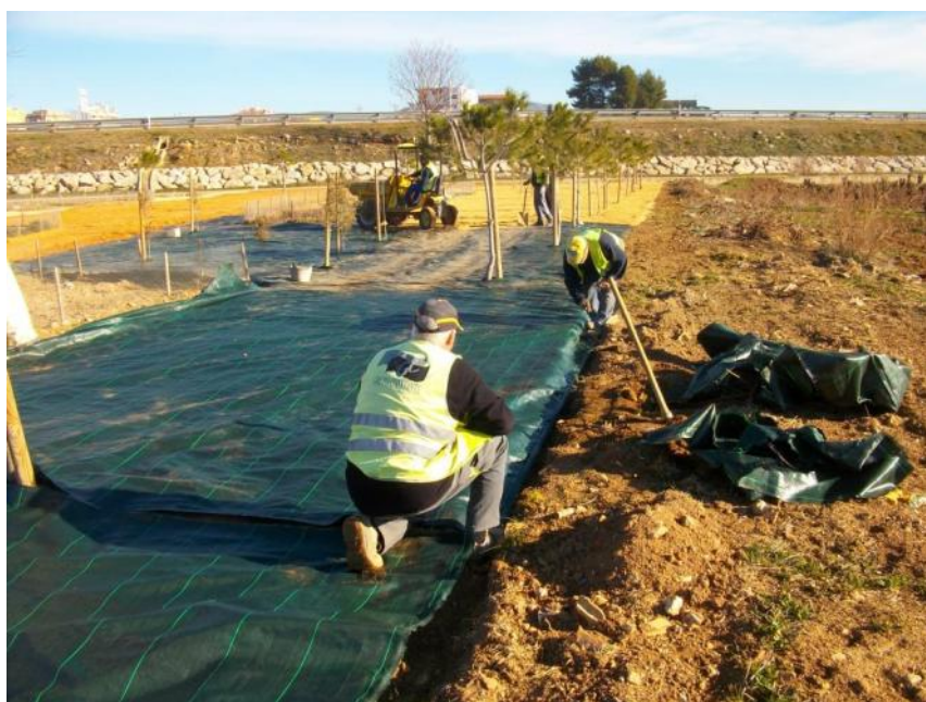
Construcción de zona estancial junto al río Magro, en T.M. De Utiel