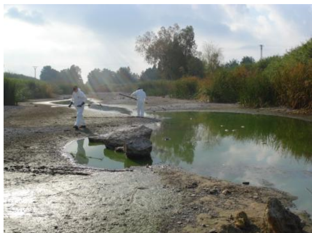
Durante la actuación.