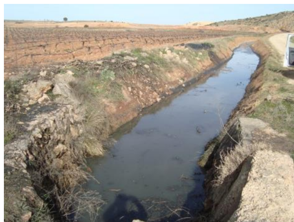
Después de la actuación.