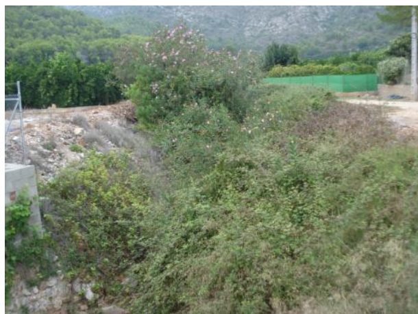
Antes de la actuación.

Desbroce selectivo de la vegetación para la recuperación de la capacidad hidráulica.