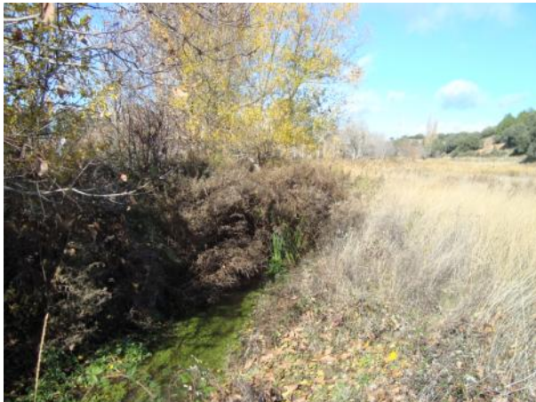
Antes de la actuación.