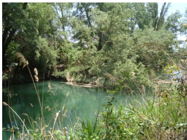
Antes de la actuación.