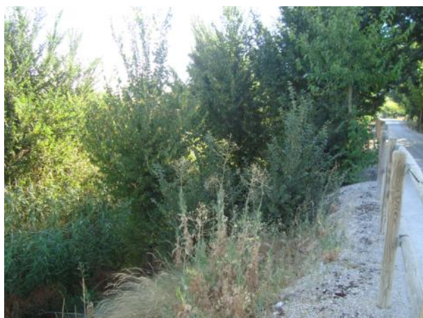
Antes de la actuación.