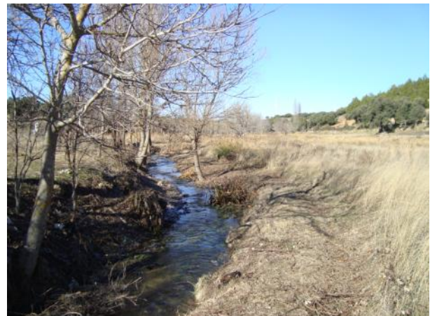
Después de la actuación.