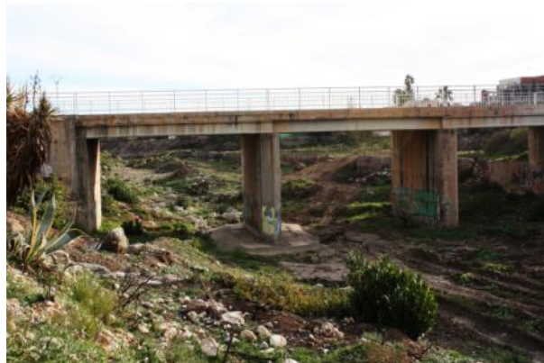
Después de la actuación.