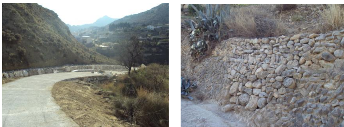
Acceso al río Coscó en Xixona (Alicante)