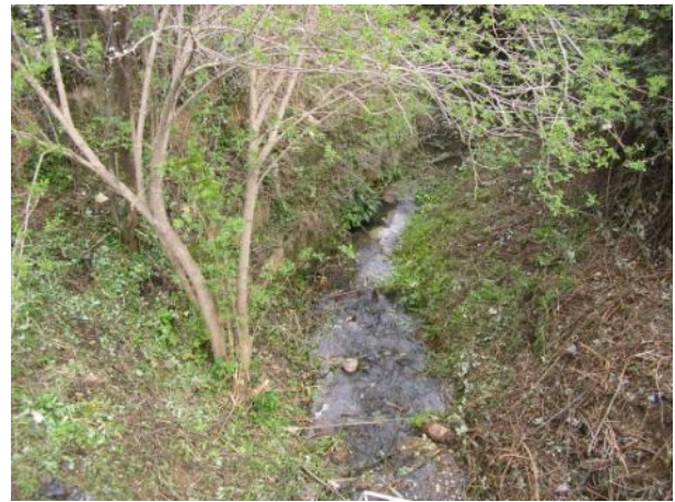
Después de la actuación.