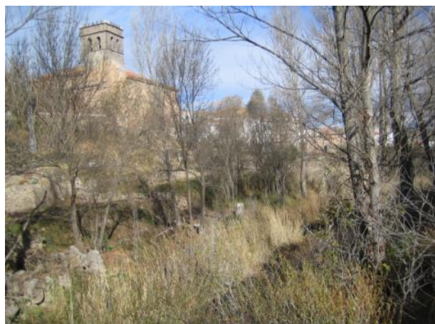
Antes de la actuación.

Limpieza, podas y clareos sobre los pies enfermos, muertos o malformados y desbroce selectivo para la recuperación de la capacidad de desagüe.