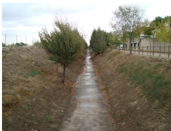
Después de la actuación.