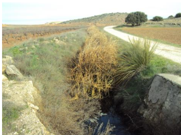
Antes de la actuación.