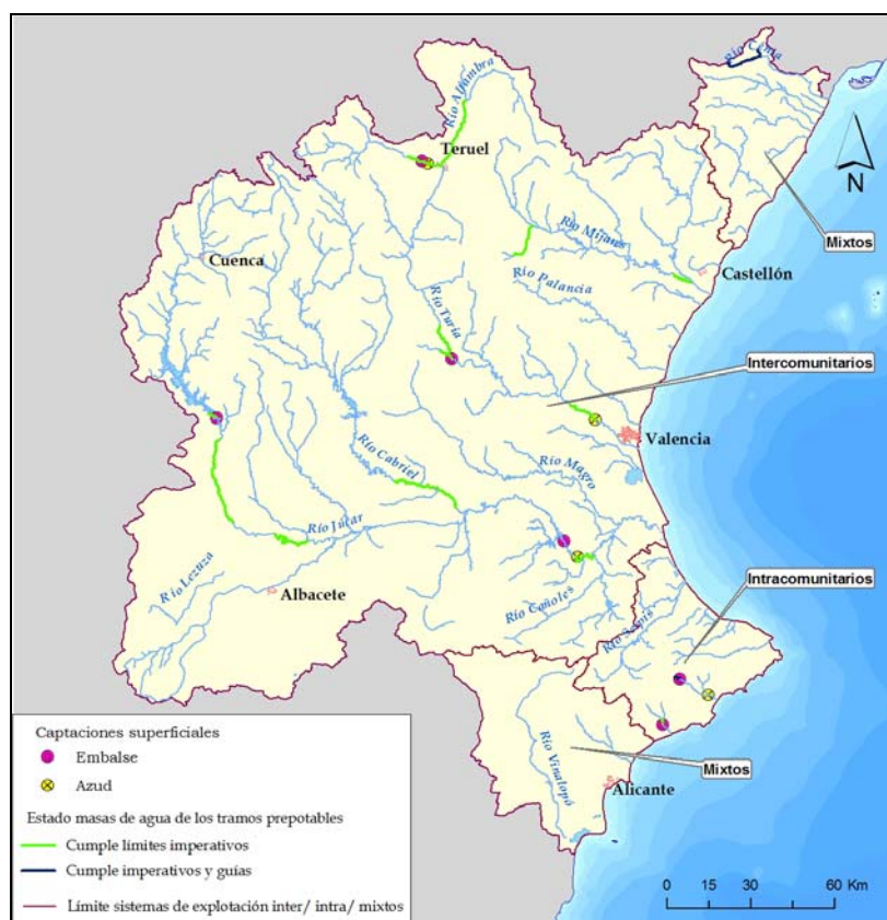
Figura 11. Grado de cumplimiento de las masas de agua con captaciones de agua superficial para abastecimiento urbano en la CHJ.

En la tabla siguiente se muestran las masas de agua asociadas a los tramos prepotables y la valoración de calidad según los criterios de la Directiva 75/440/CEE .