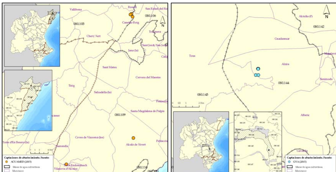
Figura 3. Nuevas captaciones de agua subterráneas previstas a 2015. Izquierda: Sondeos del Maeztrazgo, Derecha: Abastecimiento a la Ribera

Adicionalmente han sido recopiladas las captaciones cuyo puesta en servicio esta prevista en el horizonte 2015. De estas captaciones destacan las asociadas al Sistema de Explotación Júcar fruto del “Proyecto de abastecimiento a las Comarcas de la Ribera” desarrollado por la Generalitat Valenciana, así como las asociadas a las campañas de prospección de aguas subterráneas en la zona del Maeztrazgo desarrolladas por AcuaMed.