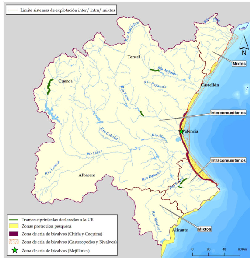
Figura 4. Zonas de Protección de Especies Acuáticas y Zonas costeras de protección de moluscos.

La figura siguiente muestra los tramos ciprínícolas declarados a la UE, así como las zonas de producción de moluscos y otros invertebrados marinos y las zonas de protección pesquera.