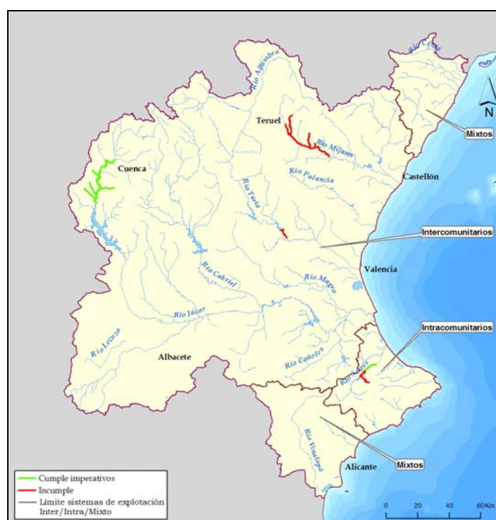
Figura 12. Cumplimiento de valores imperativos y guía de Especies Acuáticas Continentales.

La cuantificación del estado se recoge en el mapa y tabla siguientes como recopilación de los resultados del informe de calidad del 2006 desarrollado por Comisaría de Aguas de la CHJ para tramos ciprinícolas.