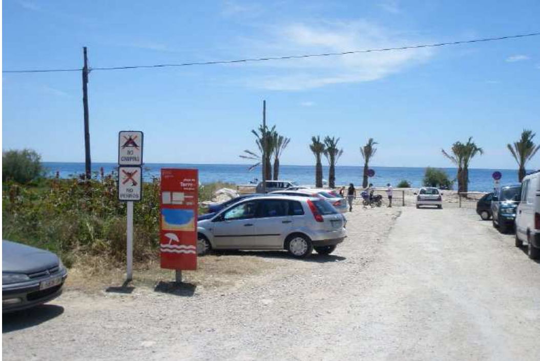
Se puede observar la alta afluencia de visitantes.