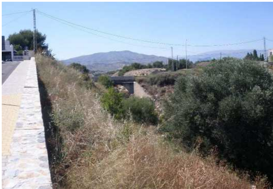
Estado actual del cauce

Por otra parte, en el tramo bajo del cauce, se observa una ocupación dispersa del terreno por viviendas privadas. Estas están a una cota más elevada que el cauce, por lo que el riesgo no es tanto por la posibilidad de desbordamiento sino por ablación de los taludes de la margen, que pudiesen provocar deslizamientos de tierras.