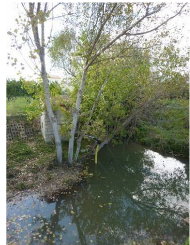
Manantial en la cabecera del Barranquet, sobre arcillas y margas del Keuper.