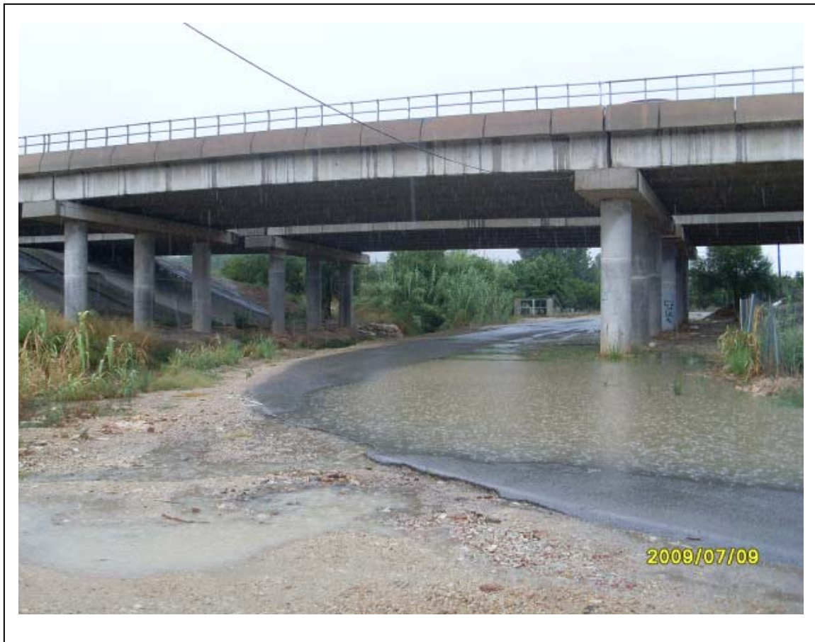
Paso en la AP-7. ALT-306

Durante todo el trazado el cauce se ha visto constreñido por la afección de los campos de cultivos, camino de servicio para acceder a las parcelas, motas de protección de tierra y de mampostería realizadas en tramos de longitud reducida, sin ninguna coordinación, de manera que en alguno de los casos, el cauce se reduce a una acequia de una anchura que no llega a los 2 metros.