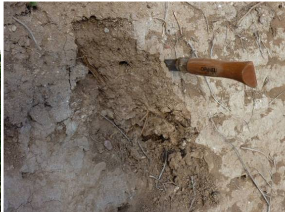
Cauce todavía encajado con orillas limosas y alguna grava muy fina en el relleno de la vaguada.