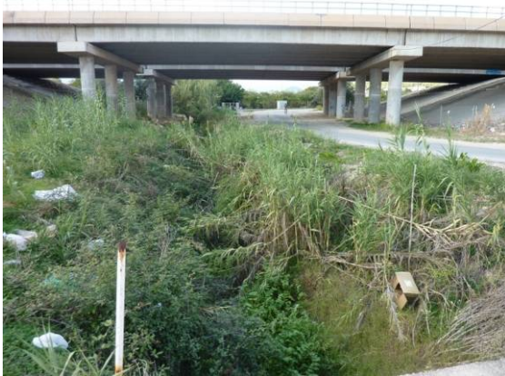
Paso del Barranquet bajo la autopista A-7