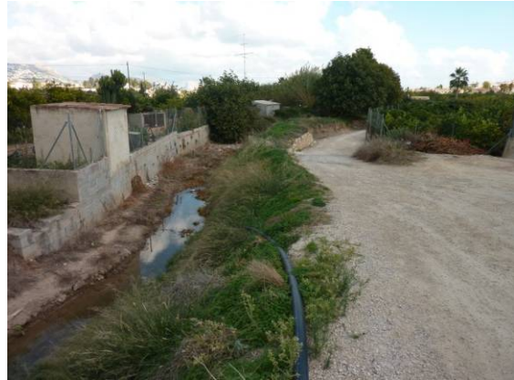
Barranquet, ligeramente encajado a la altura del colegio "El Blanquial". Aquí discurre entre orillas limosas y con un pequeño caudal.