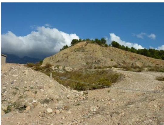
Cabecera del Barranquet entre relieves de margas, arcillas y yesos del Keuper coronados por conglomerados con bloques.

En cuanto a la dinámica sedimentaria, puede decirse que la carga sólida del barranco se reduce a cierto contenido de materiales limoarcillosos con alguna grava fina, como se ha observado en las orillas del cauce. A pesar del reducido tamaño de la cuenca y el suave relieve, las vertientes arcillosas con yesos son fácilmente erosionables y se acumulan materiales finos en las márgenes del barranco y en las vaguadas de fondo plano.