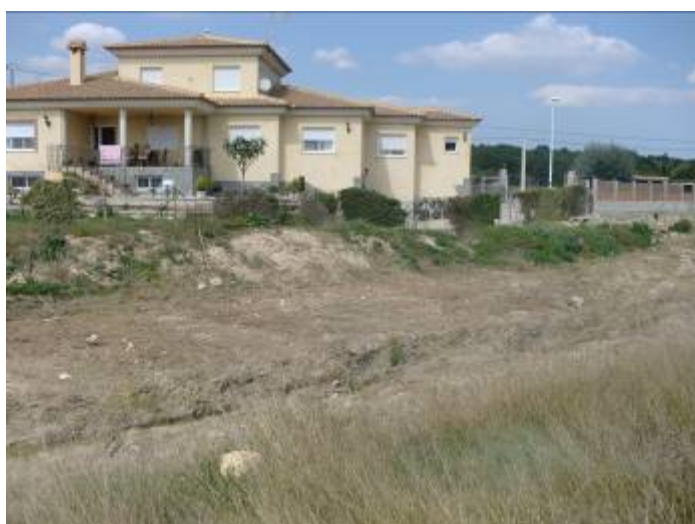
Foto 32: Viviendas en margen derecho del barranco del Quisi tras atravesar puente de la avenida Casanova y que se encuentran muy expuestas a riesgos de inundación.