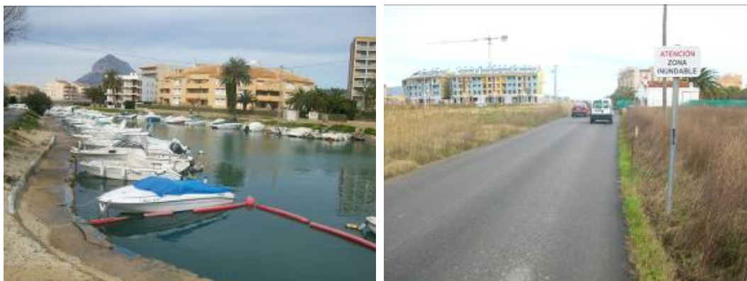
Fotos 19 y 20: Canal de la Fontana con embarcaciones. A la derecha cartel advirtiendo de zona inundable en El Saladar.