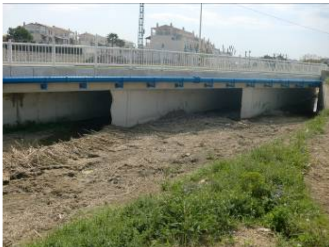
Foto 31: Puente de la avenida Casanova, se observa lo esviado de los marcos.