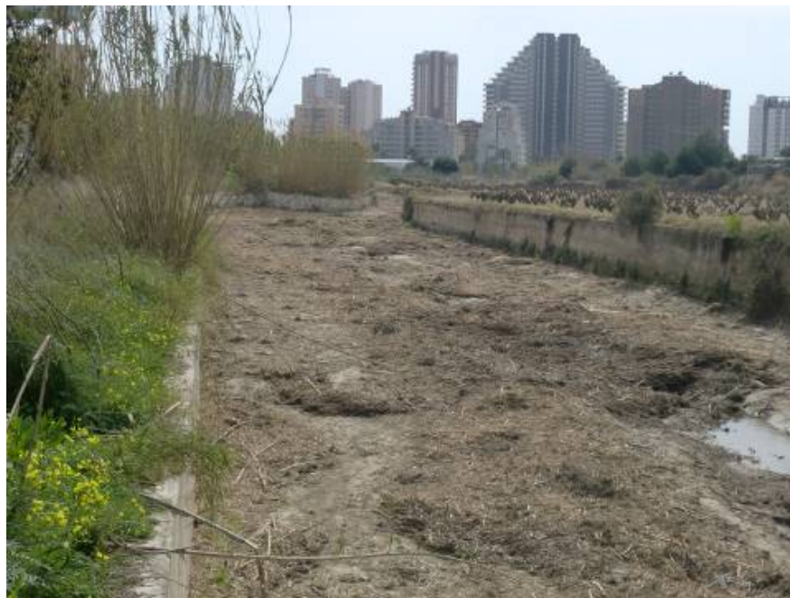
Foto 35: Sección encauzada correlativa a las anteriores hacia aguas abajo.