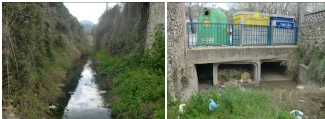
Fotos 1 y 2: Tramo final barranco Passules. Derecha, tres marcos de 1,75 x 1 m. de desagüe al Gorgos bajo CV-750.

Además de la mota propuesta delante del Centro de Salud y que se mantiene en esta alternativa, en el barranco del Cau se recrecerá en 1,5 metros el muro lateral que tiene el barranco en su margen derecho tras pasar el puente de la carretera CV-745 y que actualmente tiene únicamente una barandilla, de esta manera se protegen las viviendas más afectadas por las inundaciones en Líber.