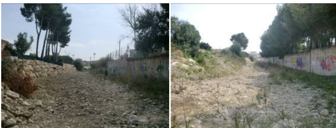
Foto 25 y 26: Secciones entre los puentes de Partida Gargasindi y Avda. Casanova. En el margen derecho del cauce muro que protege centro escolar, en el margen izquierdo tramo de escollera que protege camino y que se pierde más adelante.

Se plantea la sustitución o ampliación de tres puentes en el tramo urbano del barranco del Pou Roig: el de la Partida Gargasindi constituido por dos cajones de 4,0 x 2,5 metros que constriñe claramente la sección del barranco ya que en ese punto es de aproximadamente 15 metros de anchura como se aprecia en la foto 23, el de la avenida Casanova con pila central que conforma dos compartimentos de aproximadamente 4,1x2,25 metros (foto 24) y el de la avenida de los Ejércitos Españoles constituido por cinco vanos de dimensiones aproximadas 0,9 x 1,15 metros muy fácilmente obstruible y rebasable por las avenidas como se ve en las fotos 27 y 28. Todos ellos deben ser sustituidos por otros de mayor capacidad y sin pilas ni elementos que puedan dificultar el flujo de agua.