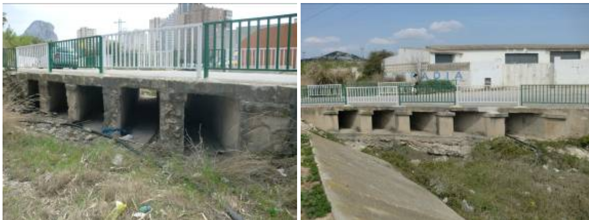
Foto 27 y 28: Puente bajo la Avenida de los Ejércitos, desde aguas arriba y abajo respectivamente donde se aprecia la dificultad para su drenaje y lo fácilmente que puede obstruirse.