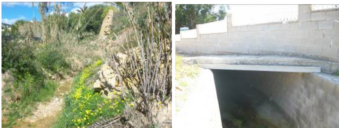
Fotos 54 y 55: Tramo final del barranco previo cruce con CV-746. Derecha, obra de paso bajo la CV-746.

Se incluye en esta alternativa aumentar el paso inferior del barranco bajo la carretera CV-746 que actualmente es un cajón de cerca de 4 m 2 a un marco de 3 x 1,75 metros para mejorar la evacuación impidiendo afectar a la carretera. Igualmente debe ampliarse el paso bajo la CV-746 del afluente Aigüera d'Altamira, actualmente 1,5 x 0,75 metros (1,12 m 2 ) al menos a la sección que mantiene bajo el paso del supermercado, de unos 2,5 m 2 .