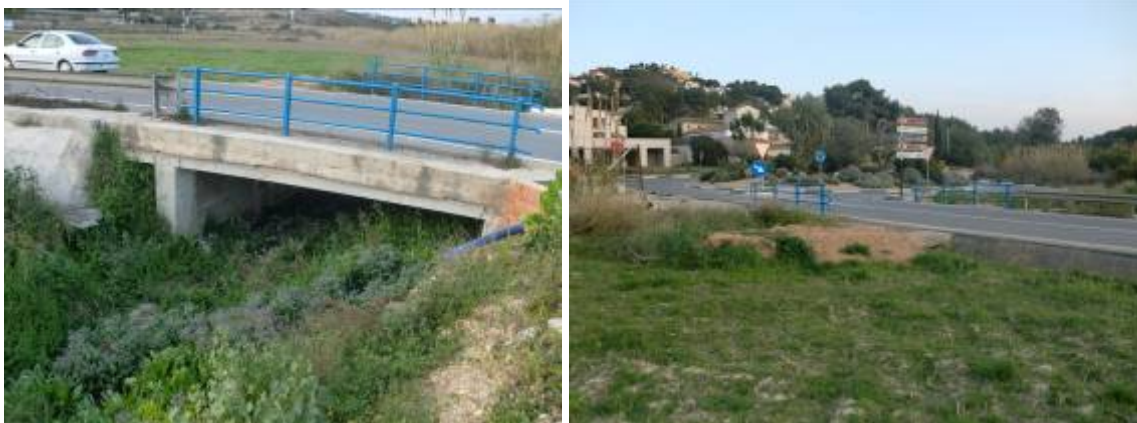
Fotos 40 y 41: Paso transversal actual de la carretera CV-743 insuficiente. Derecha, al fondo rotonda inundable que conecta carreteras CV- 743 y CV-737

Para impedir desbordamientos que afecten a las infraestructuras viarias citadas se recrecerá el murete lateral del actual cauce en su margen izquierdo en una longitud aproximada de unos cien metros.