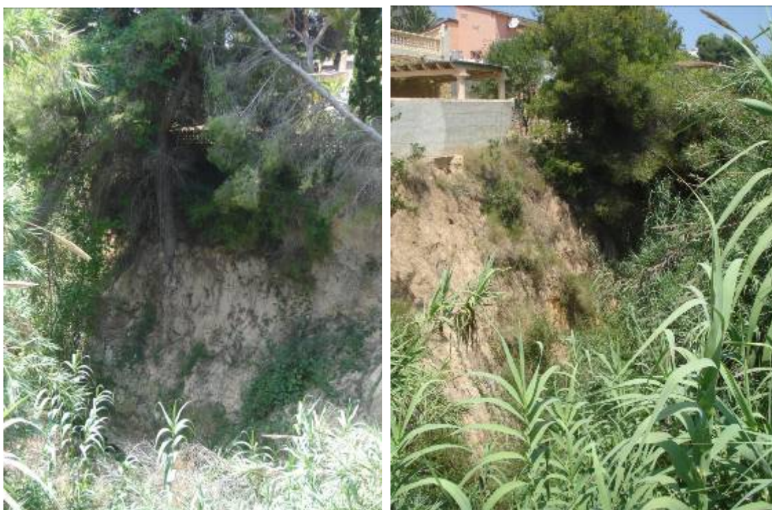
Fotos 45, 46 y 47: Varias imágenes en las que se aprecia la abundante vegetación y árboles caídos que pueden obstruir el cauce

Además se propone la sustitución de los puentes de la calle Carpa-Baladrar, la calle Moixó-Baladrar ambos en las inmediaciones del campo de Golf por resultar su sección insuficiente y ser fácilmente obturables. También se propone ampliar la sección del puente presa-agujero de la avenida Baladrar dado que la laminación que ofrece se constata en los modelos que es escasa y resulta mayor el riesgo de desbordamiento e inundación por colmatamiento de la misma.