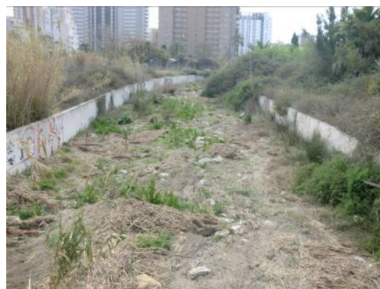
Foto 38 y 39: Sección aguas arriba y aguas abajo del puente de la avda. Rumania respectivamente. CONFEDERACIÓN HIDROGRÁFICA DEL JÚCAR