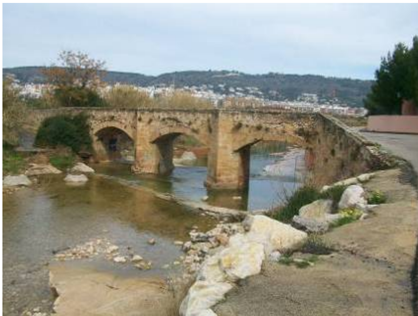
Foto 17: Puente del Llavador, inicio de los desbordamientos por margen derecha donde se encuentra la desaladora de Xàbia.