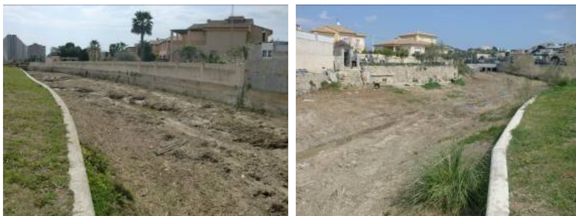
Foto 33 y 34: Sección encauzada pocos metros más delante de las anteriores, fotografías hacia aguas abajo y aguas arriba respectivamente.