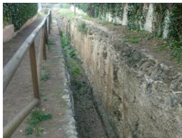
Fotos 15 y 16: Dos tramos de la "Séquia de la Nòria" cuya longitud hasta el mar supera los 100 metros de longitud y 4 de profundidad.

Una excelente solución para la recuperación de este espacio y su puesta en valor como humedal sería la inclusión dentro del dominio público marítimo-terrestre cediendo el Ayuntamiento su gestión a la Jefatura de Costas de forma que se mantenga permanentemente inundado. Así pasaría de una situación de alto riesgo de degradación a un centro de atención e interés ambiental orientado hacia la