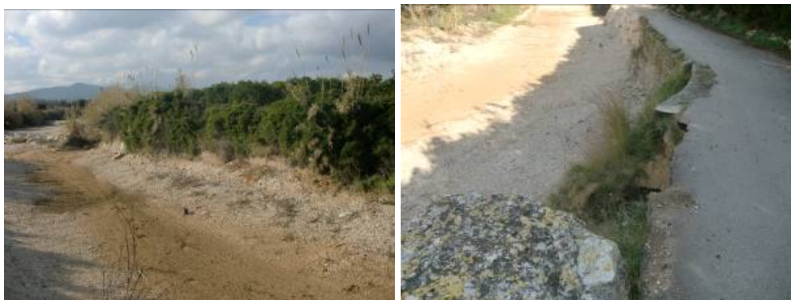
Fotos 13 y 14: Taludes del río Gorgos deteriorados. A la derecha puede observarse al fondo un tramo de escollera y al lado muro de mampostería junto a una sección desprendida.

Por supuesto se incluyen en esta propuesta la limpieza y el mantenimiento periódico de todos y cada uno de los cauces existentes en el modelo y las actuaciones de protección civil para predicción de avenidas y alerta a la población.