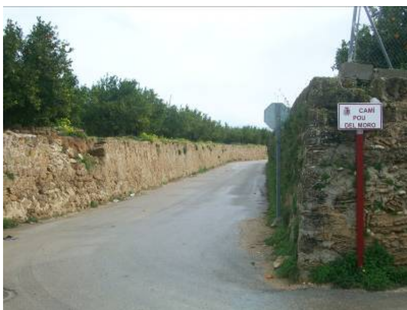
Foto 18: Camí Pou del Moro junto al anterior puente. Se observa la cota de los campos contiguos que provoca su encajamiento y que estos caminos actúen como auténticos cauces.