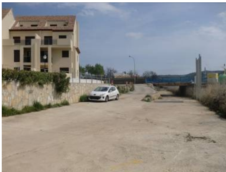
Foto 3: Muro a recrecer en 1,5 metros para proteger viviendas anexas al barranco del Cau en Líber.

Además de la mota propuesta delante del Centro de Salud y que se mantiene en esta alternativa, en el barranco del Cau se recrecerá en 1,5 metros el muro lateral que tiene el barranco en su margen derecho tras pasar el puente de la carretera CV-745 y que actualmente tiene únicamente una barandilla, de esta manera se protegen las viviendas más afectadas por las inundaciones en Líber.