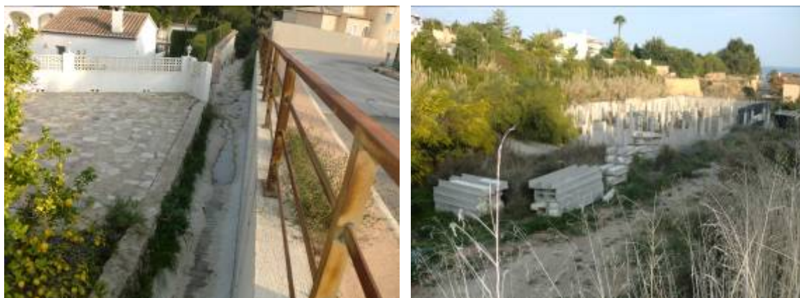
Fotos 52 y 53: Tramo final del canal a cielo abierto y entrega a barranco. Derecha, materiales y obras paralizadas ocupan la parte media-baja del cauce.

Esta es una actuación muy poco ambiciosa que con un coste muy ajustado pretende mejorar la situación actual pero que apenas consigue evacuar un caudal de 6 m 3 /s que se asocia aproximadamente a un periodo de retorno de 10 años según se reconoce en el propio proyecto, frente a los más de 20 m 3 /s de capacidad que se conseguirían con el marco propuesto.