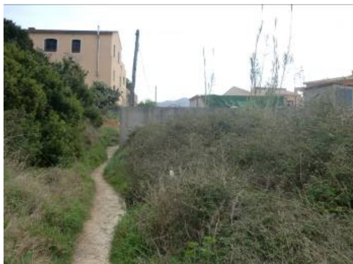
Foto 12: Al fondo de la anterior imagen, junto a la caseta del C.T., se observa que el muro de hormigón no cierra completamente pudiendo desbordar en grandes avenidas y afectando a viviendas de Líber.

Se desestima el acondicionamiento del barranco de Masserof, ya que aunque afecta a algunas viviendas al atravesar Suelo Urbanizable residencial de baja densidad presenta buen estado en general y se considera que son las viviendas las que deben saber gestionar el riesgo de ubicarse junto a un cauce y autoprotgerse de las probables inundaciones que prevé la cartografía de riesgo para los distintos periodos de retorno.