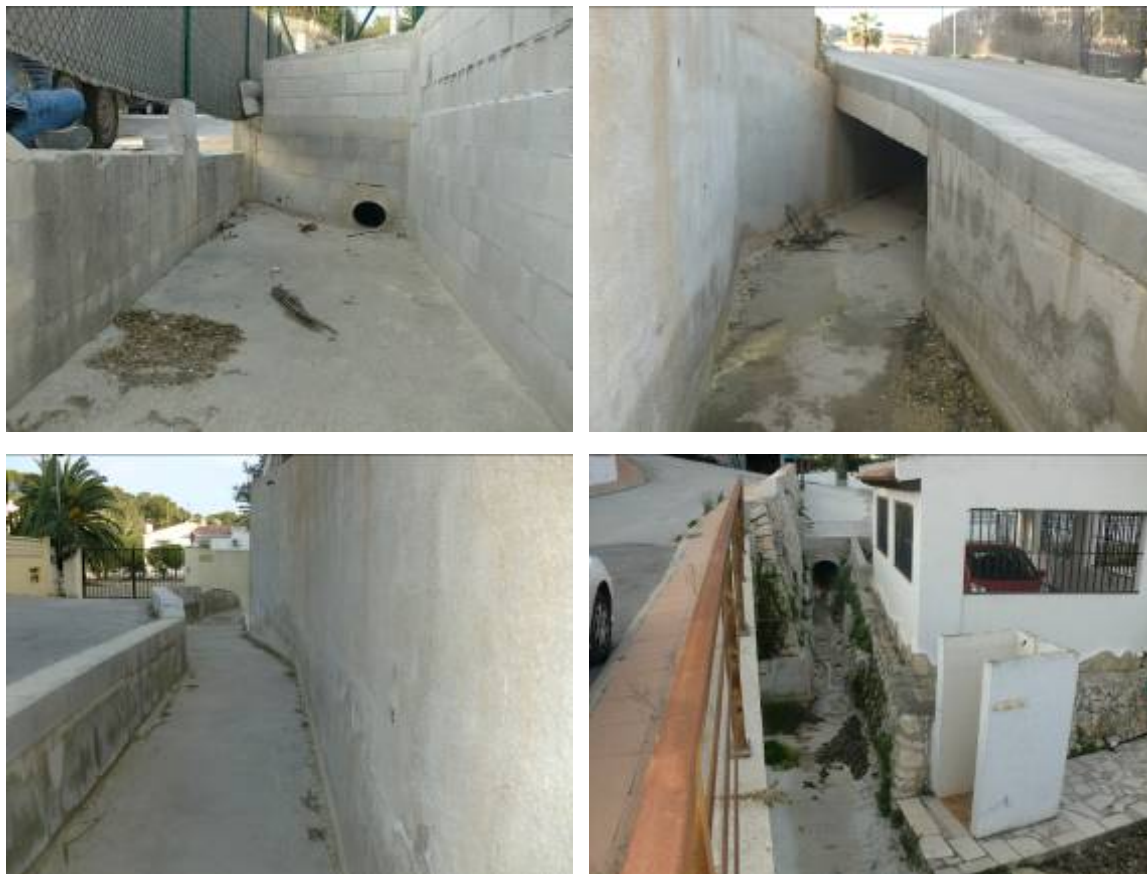
Fotos 48, 49, 50 y 51: Entrada y distintos tramos correlativos del actual canal que discurre entre calles y parcelas.

Esta es una actuación muy poco ambiciosa que con un coste muy ajustado pretende mejorar la situación actual pero que apenas consigue evacuar un caudal de 6 m 3 /s que se asocia aproximadamente a un periodo de retorno de 10 años según se reconoce en el propio proyecto, frente a los más de 20 m 3 /s de capacidad que se conseguirían con el marco propuesto.