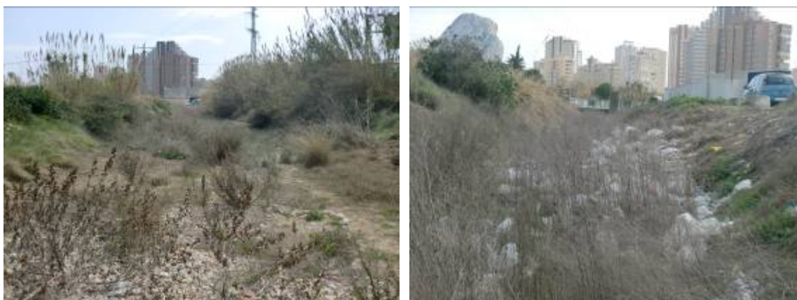
Foto 29 y 30: Tramo final del cauce urbano del barranco del Pou Roig, a pesar de la amplitud del cauce se aprecia su poca capacidad por lo que se propone el refuerzo de su margen derecho.

En lo que respecta a las estructuras atravesadas por el barranco del Quisi aunque son más generosas en sus dimensiones mantienen el problema de los elementos intermedios que en los episodios de avenida retienen grandes aportes de arrastres dificultando la evacuación de avenidas. Concretamente se trata del puente de la avenida Casanova formado por tres compartimentos de aproximadamente 3,25 x 2,25 metros (foto 31) y que además ve dificultado el correcto drenaje por la esviación que muestra respecto a la propia avenida y el de la avenida Rumania, formado por cinco cajones de 2,5x2,5 metros (foto 36). Sería conveniente sustituirlos por tableros para evitar obstrucciones al flujo y posibilidad de retención y acumulación de sólidos en avenidas aunque esta actuación no es tan prioritaria como en el Pou Roig por lo que finalmente no se modeliza.