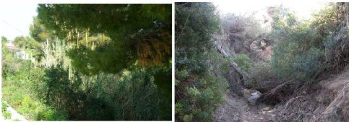
Fotos 42, 43 y 44: Varias imágenes en las que se aprecia la abundante vegetación y árboles caídos que pueden obstruir el cauce