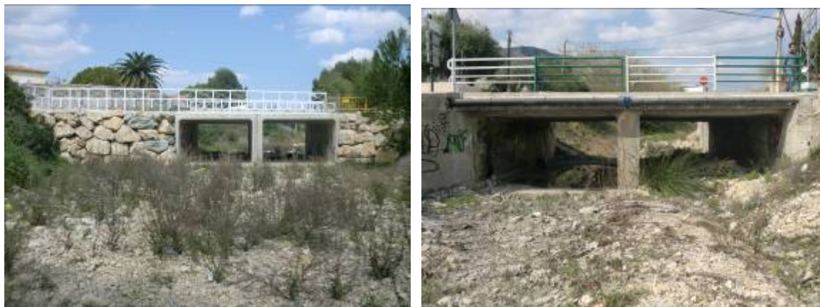
Foto 23 y 24: Puentes de la Partida Gargasindi donde se observa la reducción que suponen los cajones respecto a la anchura del cauce. A la derecha puente de la avenida Casanova parcialmente aterrado, ambos sobre el barranco del Pou Roig.