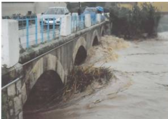
Fotos 9 y 10: Puente camí Fondo Dos. Derecha, mismo puente en plena crecida de octubre de 2.007.