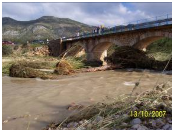
Fotos 7 y 8: Casa en el margen izquierdo del Gorgos afectada por las inundaciones de 2007. Derecha, puente de la CV-745 tras evento 2.007