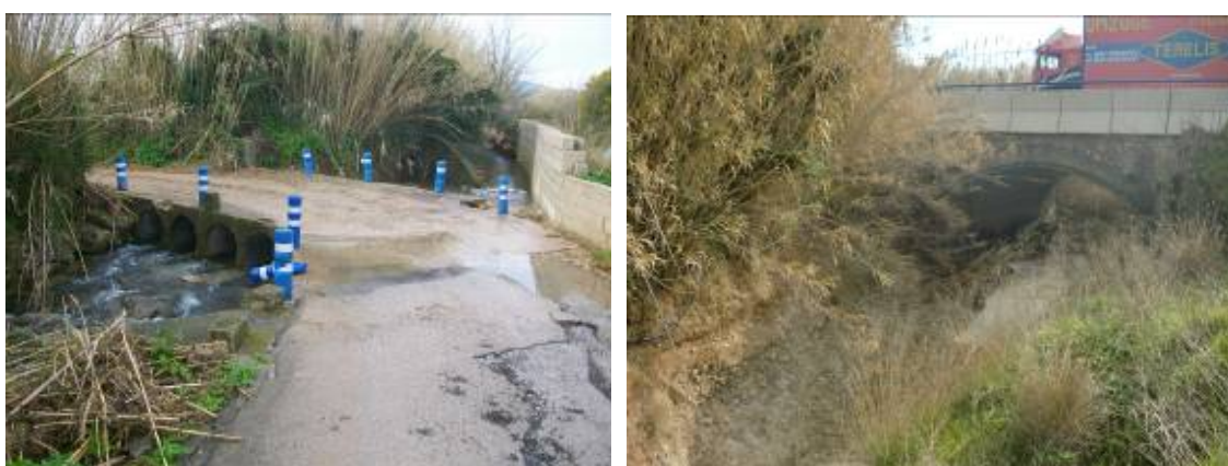
Fotos 21 y 22: Badén inundable en barranc de l'Hedra. A la derecha puente del barranc de l'Hedra bajo la CV-734.

Debe acometerse también el encauzamiento de los tramos finales de los barrancos de El Saladar y Tossalet-L'Atzúbia mediante una sección será con forma trapezoidal de 3 m de ancho en base y taludes 2H: 3V para garantizar la conectividad transversal del cauce. Ambos encauzamientos desembocan en el área de reserva de laminación controlada acondicionada de El Saladar donde se prevé se forme un lago artificial en los grandes episodios de lluvias tal como ya se ha descrito en la alternativa nº 1.