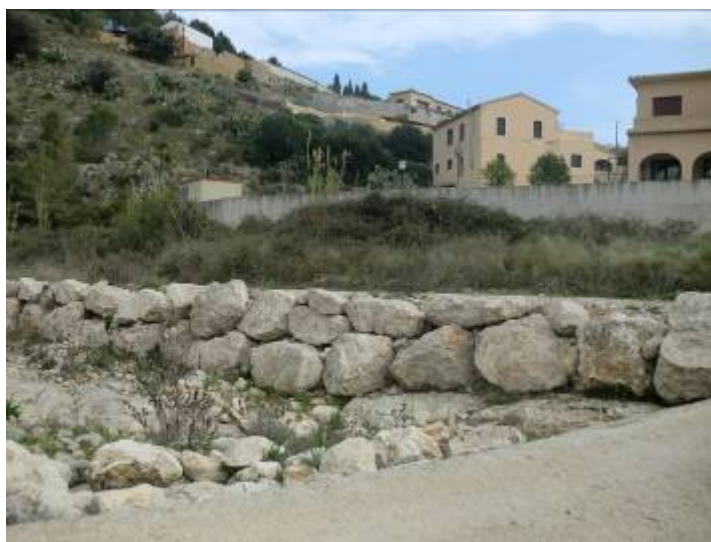
Fotos 11: Muro frontal, primero de escollera y más arriba de hormigón en la llegada frontal del Gorgos a Líber, desde este punto gira 90° a la izquierda.