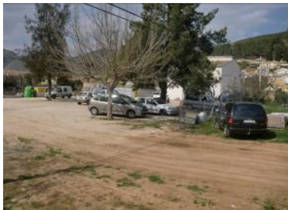
Fotos 4 y 5: Barranco del Cau, a la derecha el centro de salud de Líber en el mismo punto.

Se propone la sustitución del puente de la CV-750 (antigua AV-1421) sobre el barranco de Masserof que ya pedía el Patricova en su ficha código EAI2 junto con el puente sobre el barranco del Cau por resultar ambos insuficientes y afectar a la carretera provocando cortes de tráfico.