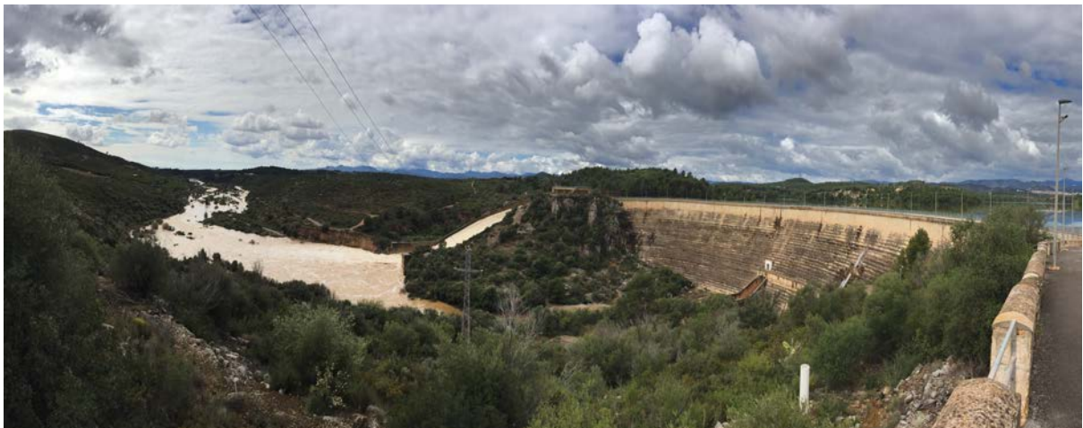
Vista general con aliviadero en carga