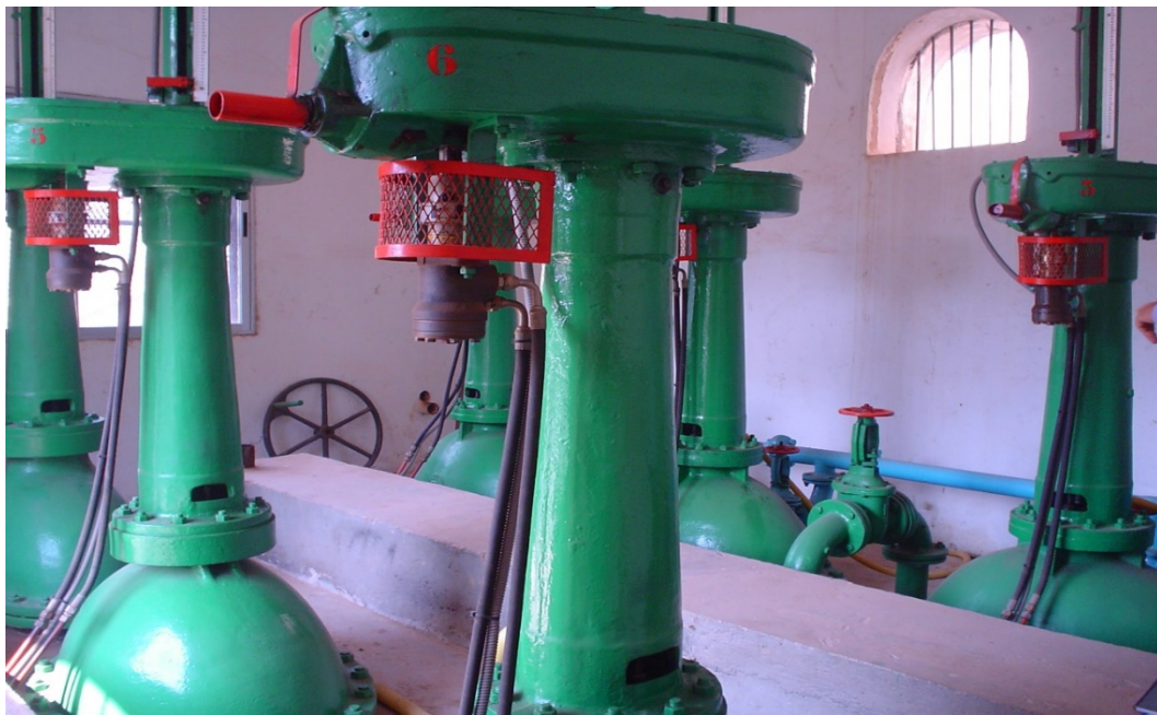
Válvulas de las tomas de riego.