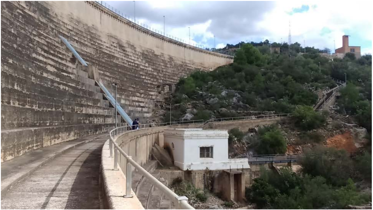
Vista del paramento de aguas debajo de la presa. Edificio de maniobra de tomas de riego.