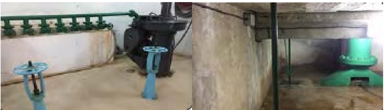
Equipos instalados en la cámara de compuertas del desagüe de fondo de la presa.