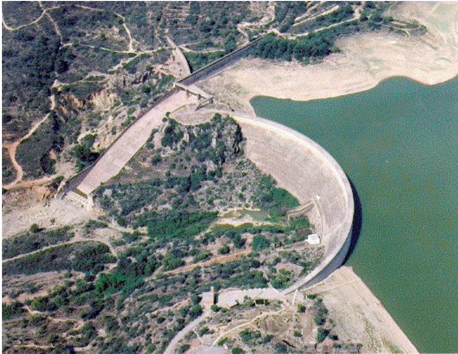
Presa de María Cristina. Vista desde aguas abajo