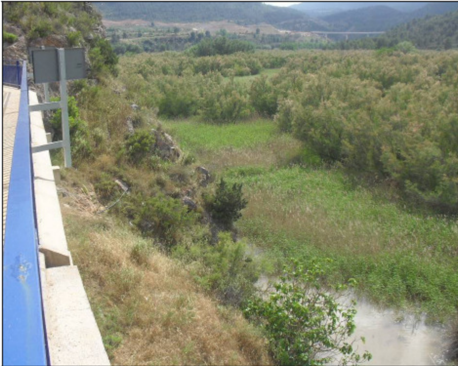
Vista desde el puente de la N-330 hacia aguas arriba del Embalse de Embarcaderos, y talud rocoso sobre el que se ubicará la escalera de acceso al mismo