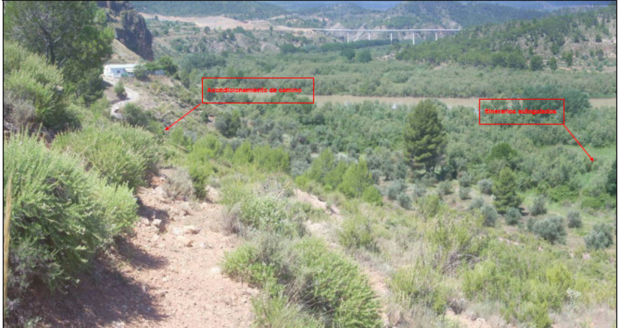
Vista desde el mirador del núcleo de Cofrentes hacia el río Cabriel