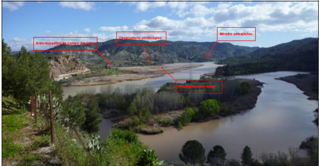
Vista desde la fachada del núcleo urbano hacia el Embalse de Embarcaderos en el mes de marzo

Fotografías y simulaciones del proyecto de acondicionamiento: