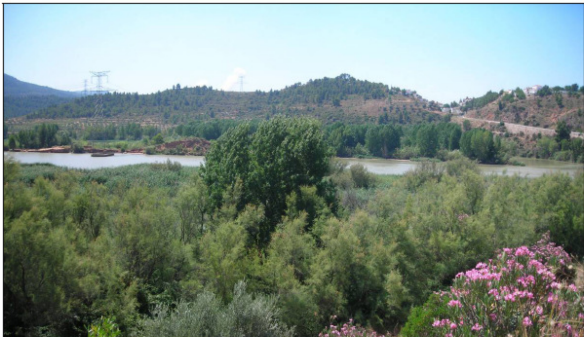
Vista desde la N-330 hacia el embalse en el cruce con el PR-CV-382