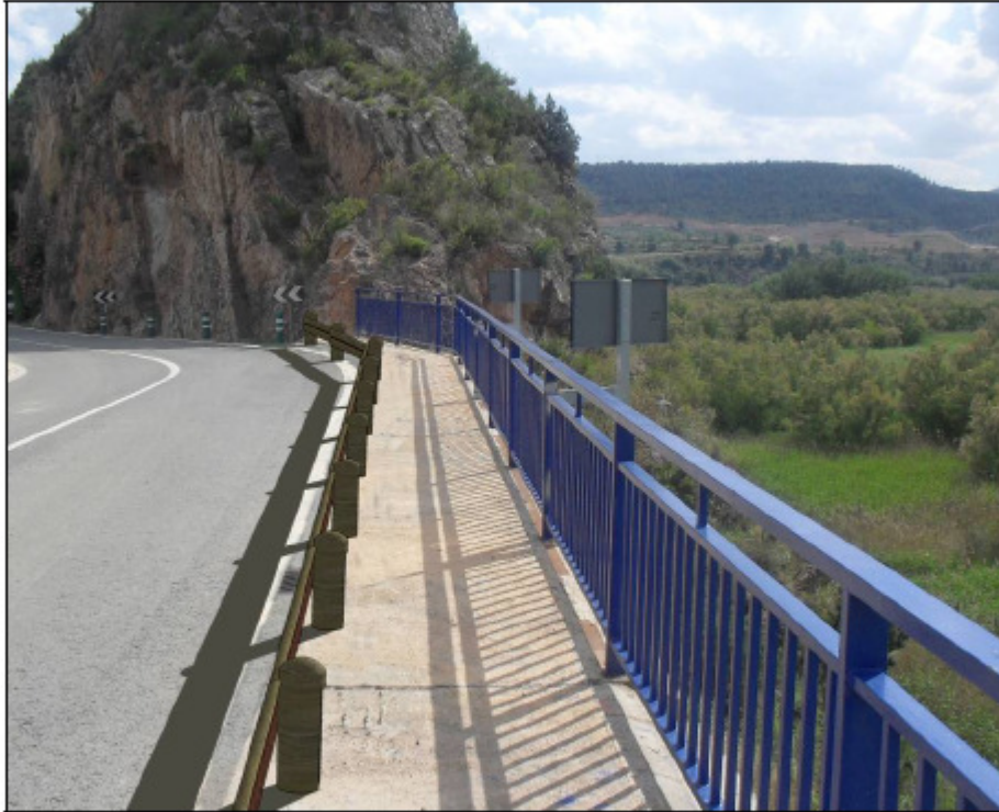
Simulación de la futura vista del puente de la N-330 una vez sustituida la barrera de seguridad de hormigón existente por la de acero corten-madera prevista en las actuaciones proyectadas.