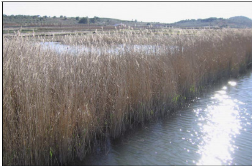
Figura 3. Zona de marjal con carrizos sobre la margen derecha del Barcal