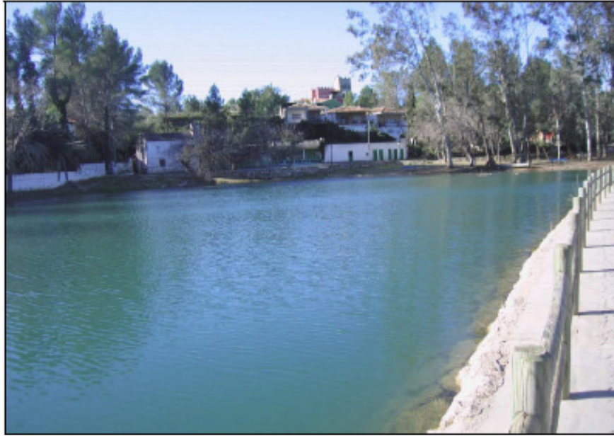
Figura 2. Vista de Playa Monte, zona de resurgencia y nacimiento del Barcal