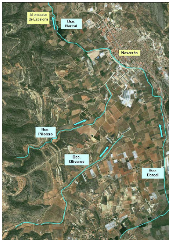
Figura 1. Situación barrancos objeto de actuación