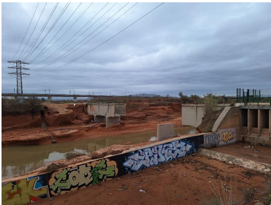
Rotura del acueducto del Poyo