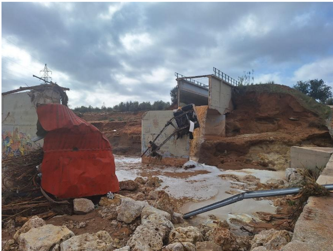
Rotura del acueducto de la Horteta