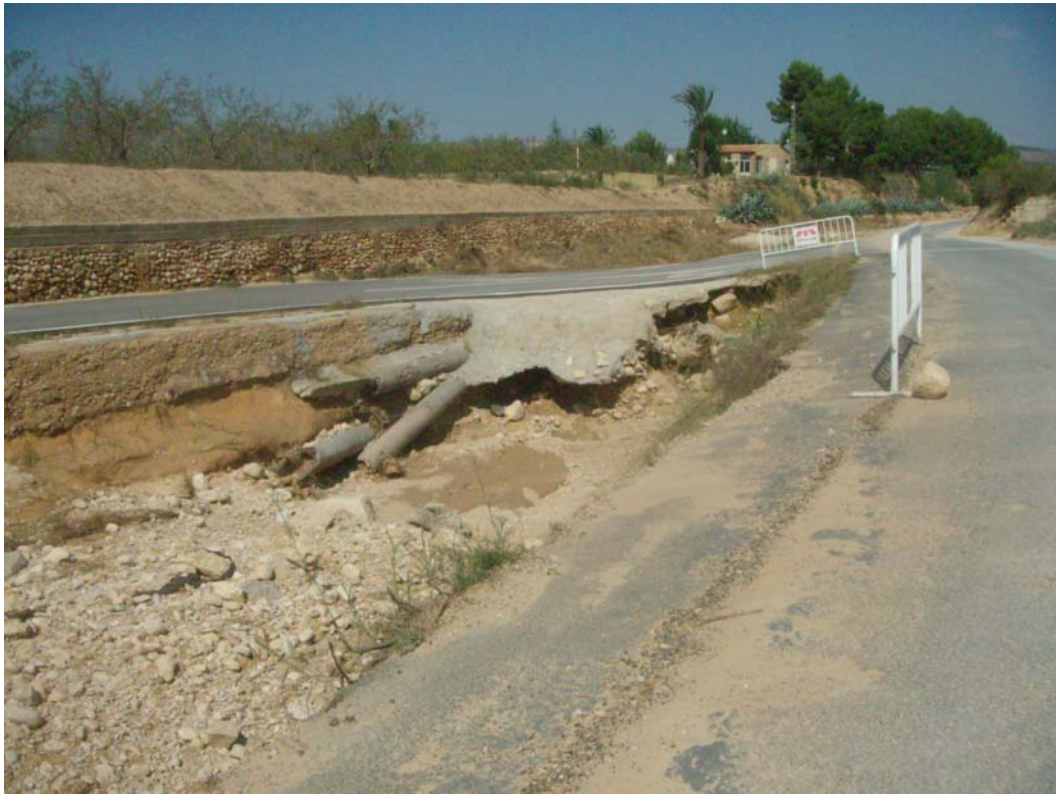
Detalle de daños puntuales producidos por la erosión de la corriente, antes de actuar.