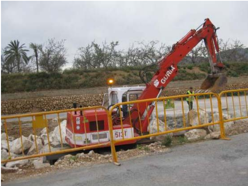
Ejecución de una de las escolleras de protección.