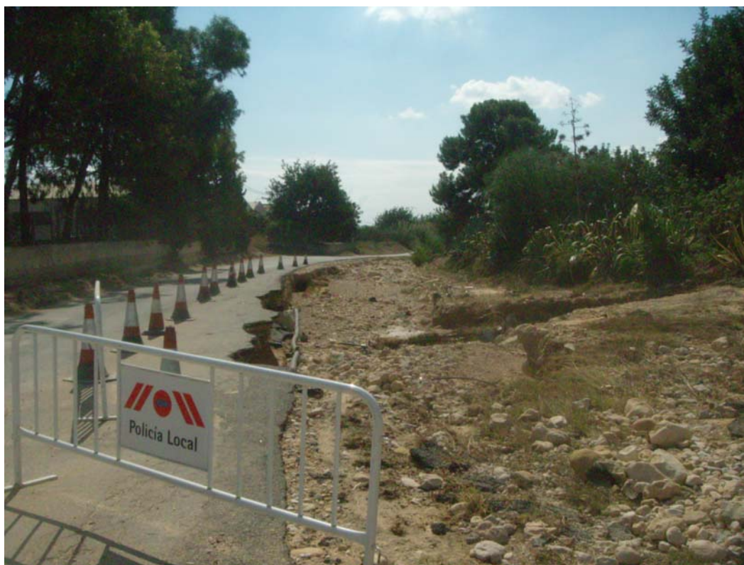
Vista general del estado del cauce del barranco antes de actuar.