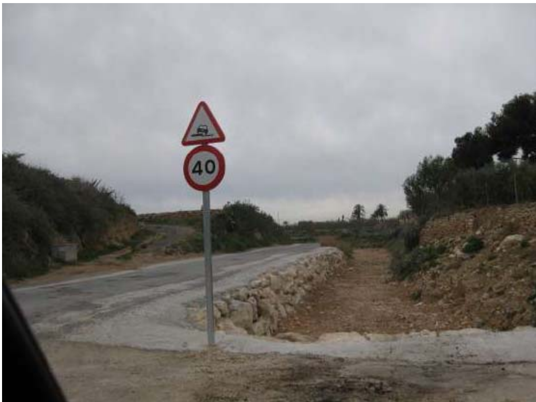
Aspecto final de uno de los tramos protegidos con escolleras.