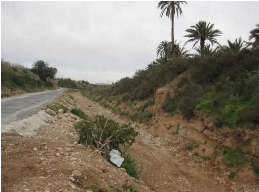
Vista general del estado del cauce del barranco tras la actuación.