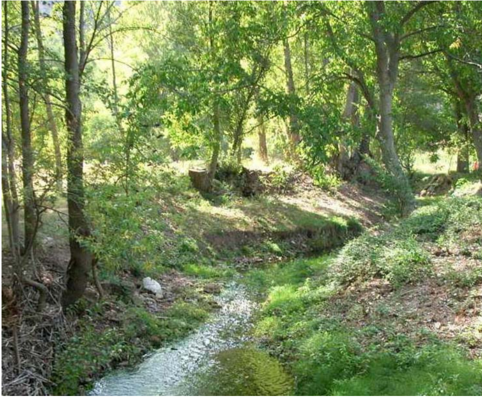
Situación después de la actuación