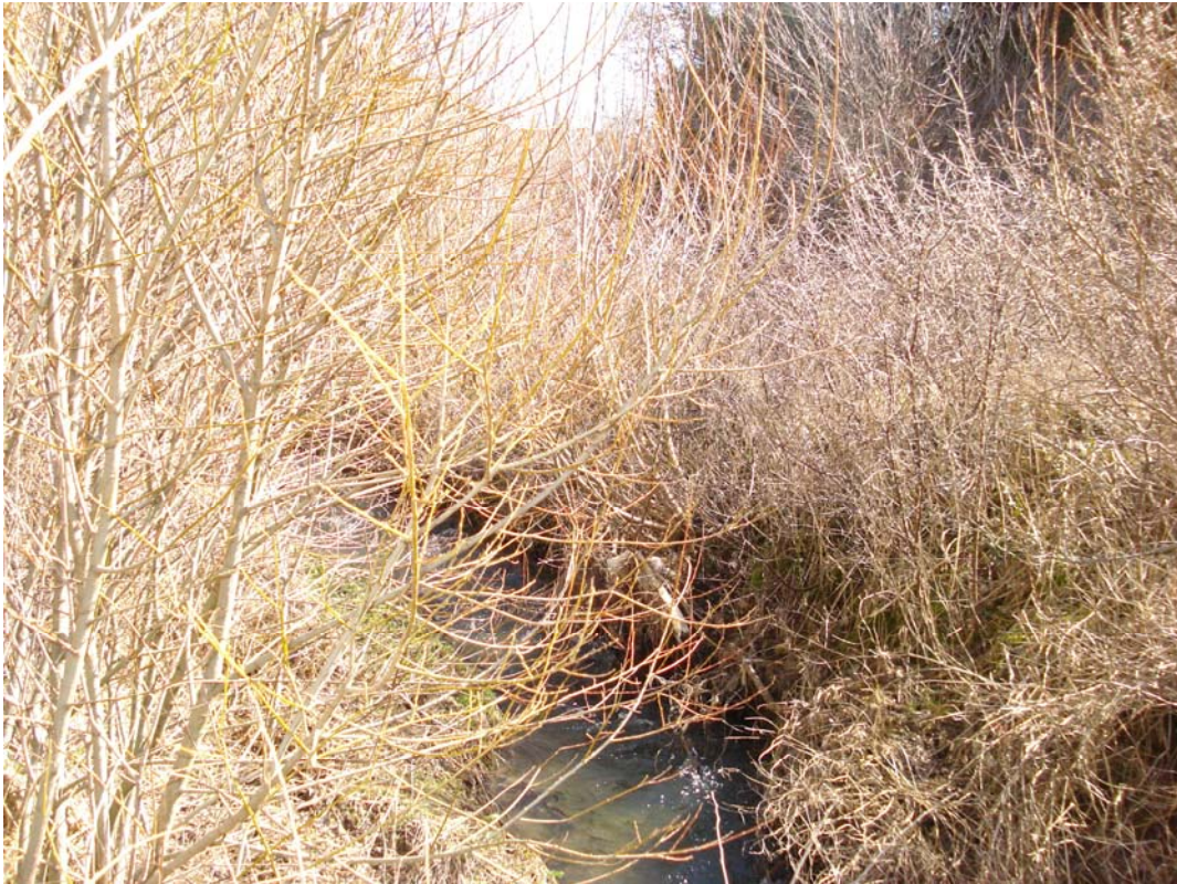
Situación después de la actuación