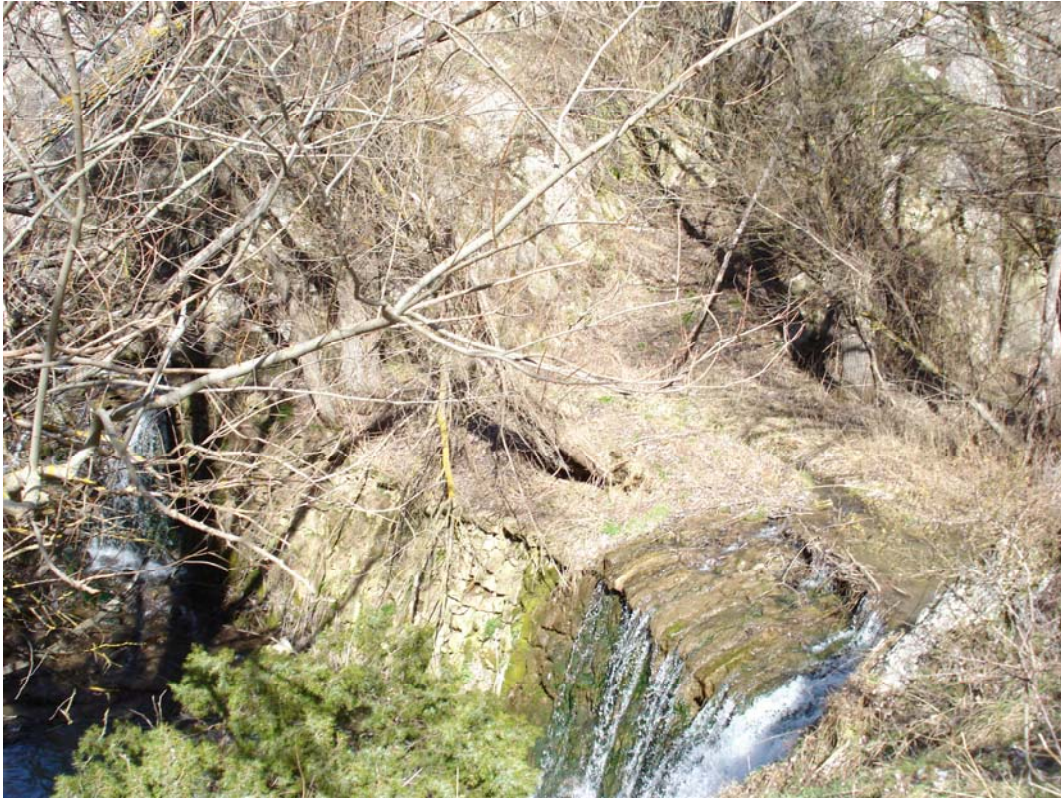
Situación después de la actuación