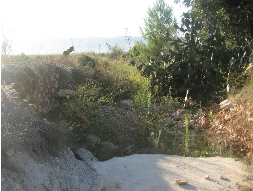
Situación anterior a la ejecución de los trabajos