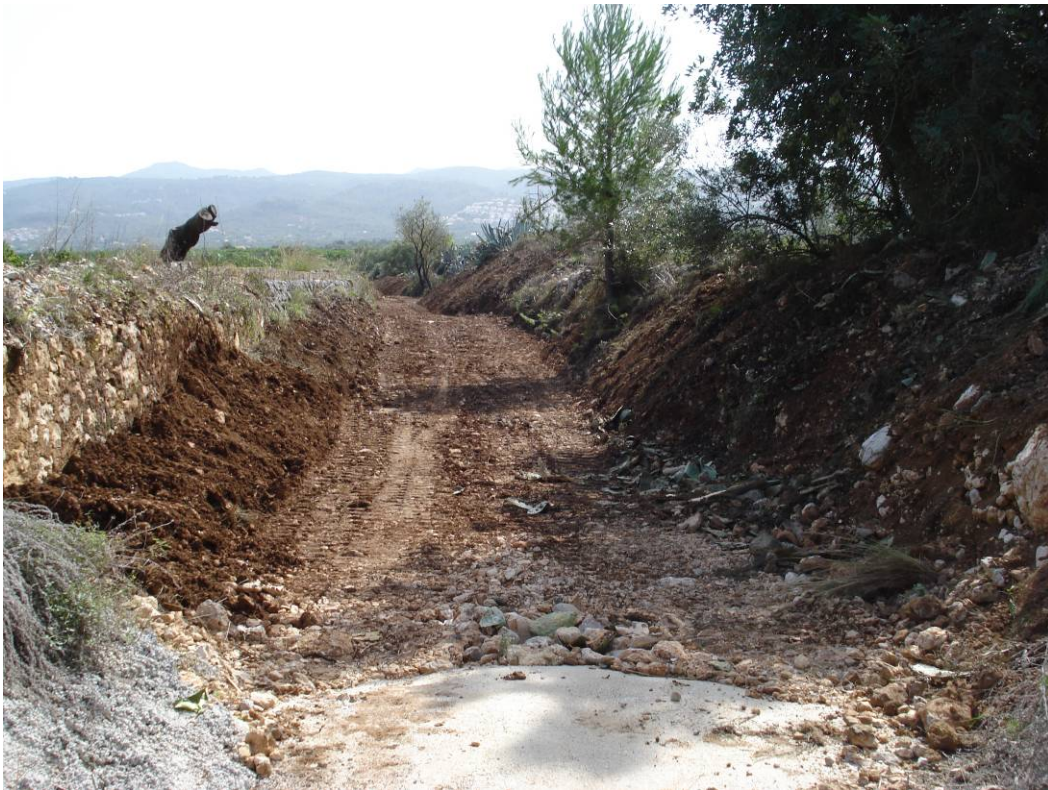
Situación posterior a la ejecución de los trabajos