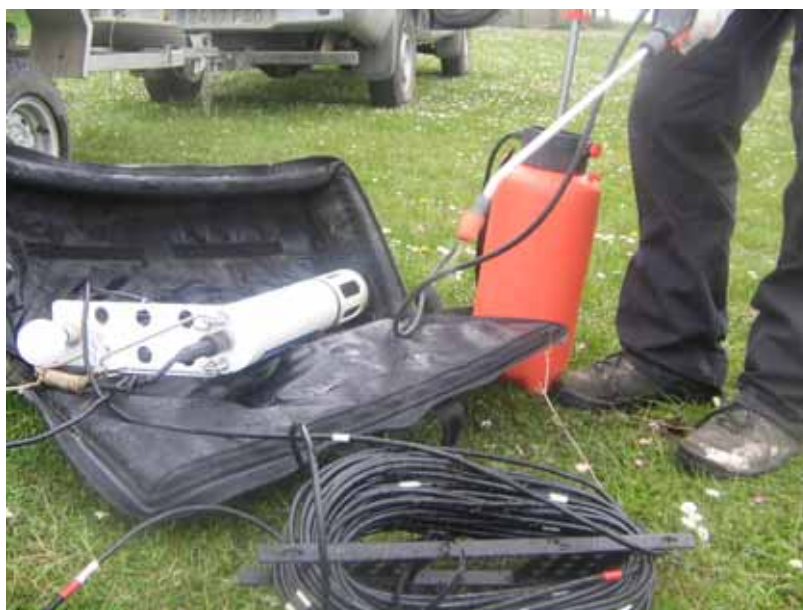
Figura 6. Desinfección de la sonda

Las artes de pesca (redes, nasas, etc.), equipos de muestreo y todos los complementos de baño deben ser desinfectados por inmersión o fumigación con una solución desinfectante de 5 mg de cloro libre por litro (ver figura 6).