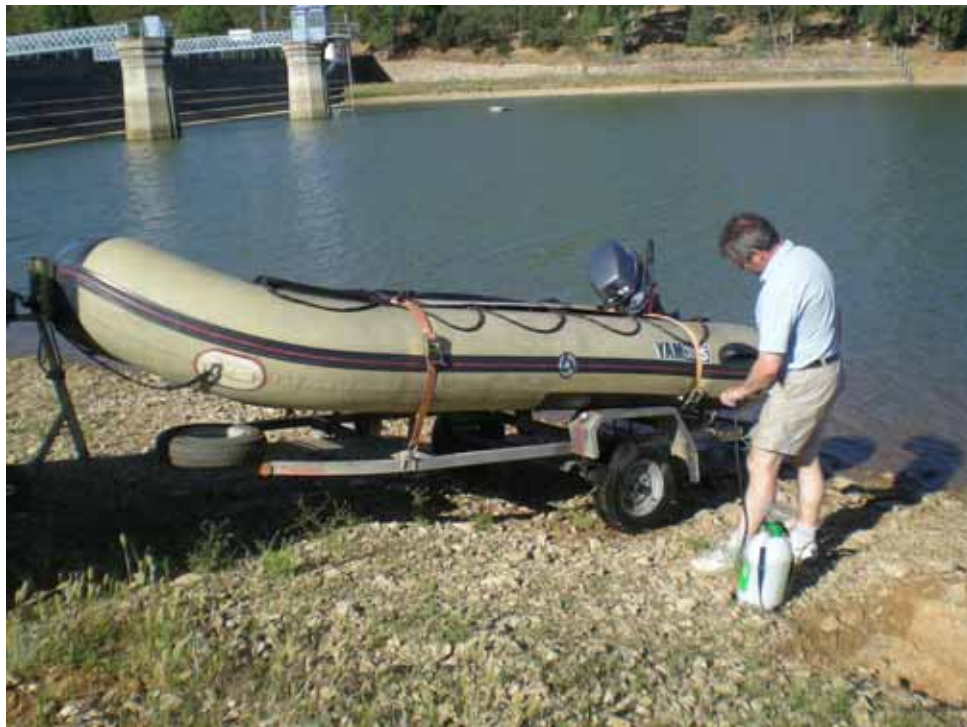
Figura 4. Ejemplo de desinfección de embarcación a motor