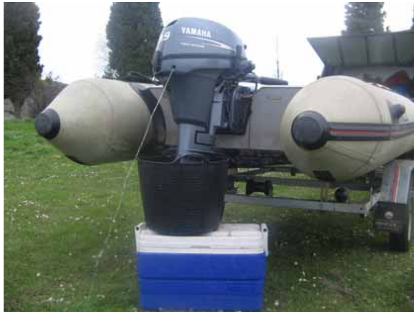
Figura 5. Limpieza del circuito del motor.