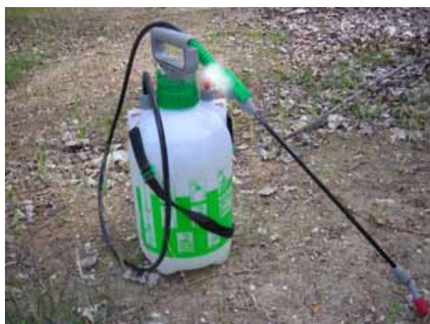
Figura 2. Pulverizador de mochila

Cuando no sea posible emplear una hidrolimpiadora como la descrita anteriormente, se empleará un pulverizador de mochila en el que se cargará la solución de agua clorada de 5 mg de cloro libre por litro. En caso de emplearse este método se debe tener en cuenta que la solución debe estar en contacto con el material a desinfectar al menos durante 10 minutos.