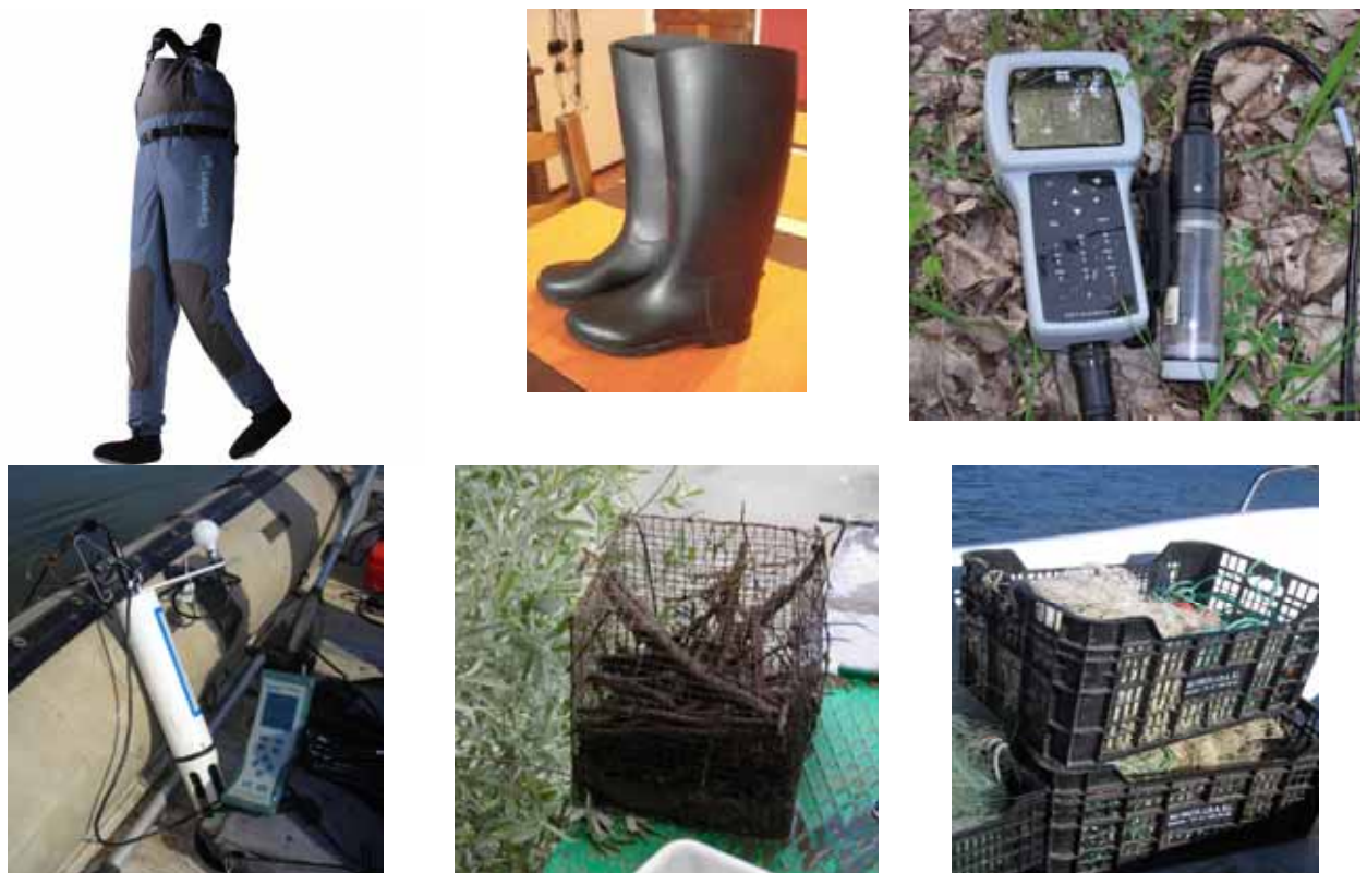
Figura 7. Ejemplos del material que tendría que ser desinfectado (vadeadores, botas, sondas, nasas y redes entre otros)

Una representación del material que debería desinfectarse se recoge en la figura 7: