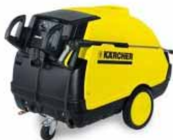
Figura 1: Hidrolimpiadora