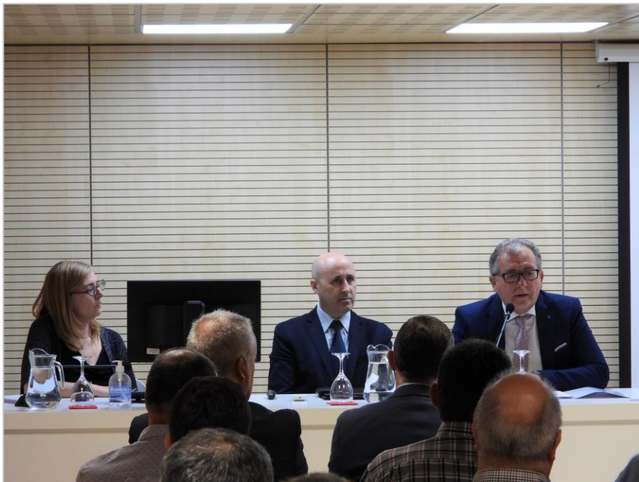
Figura 2. Bienvenida y presentación de la jornada

Hidrológico) sino que plantea medidas de gestión para poder afrontar las situaciones de sequía con mayor solvencia.