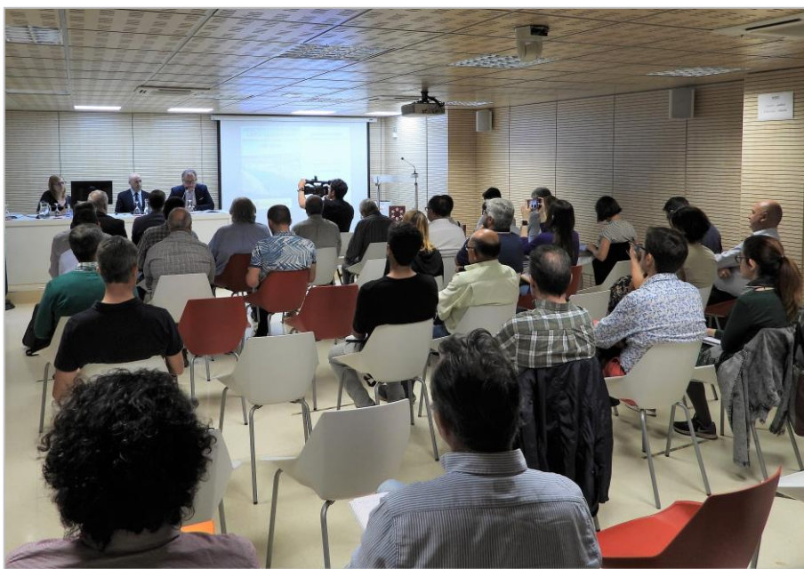
Figura 6. Vista general de la Mesa Territorial

Desde la CHJ se comentó que no puede haber registros de pozos ilegales y que el Organismo siempre actúa cuando tiene conocimiento de ellos. También se comentó en relación a las obras de reutilización con fines ambientales que los regantes no se debían preocupar por su financiación.