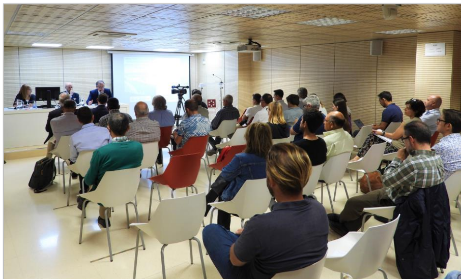
Figura 5. Presentación del Plan Especial de Sequía

sugerencias. Terminó la presentación explicando el calendario provisional previsto para las siguientes mesas territoriales.