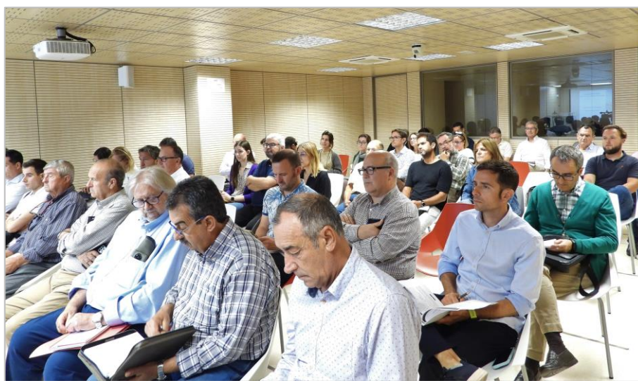
Figura 1. Asistentes a la mesa territorial