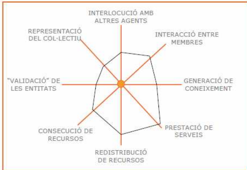
entidades de apoyo