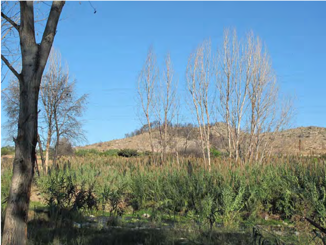
Situación después de la actuación