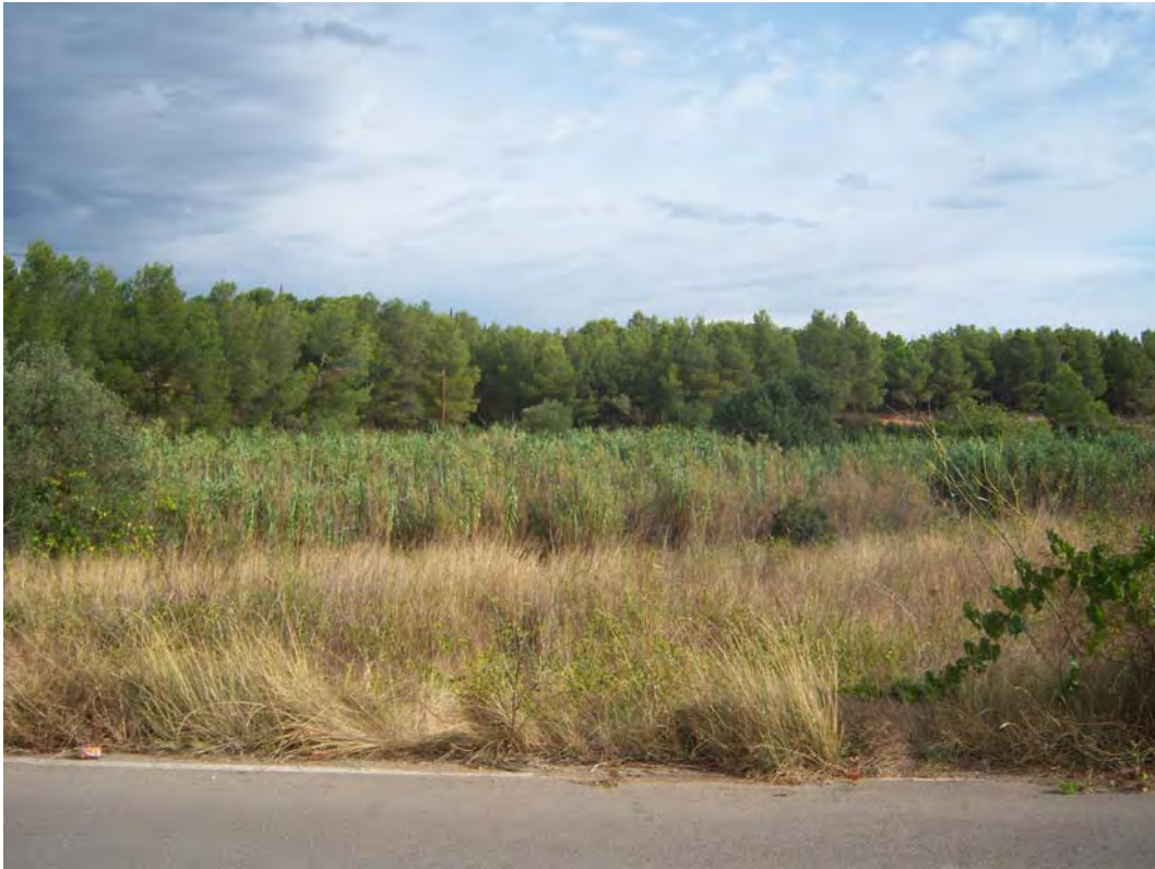
Situación después de la actuación