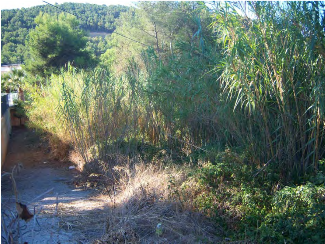
Situación después de la actuación