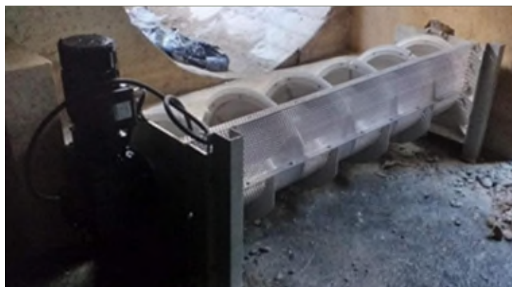
Figura 1. Ejemplo de sistema de retención: tamices en espiral instalados en aliviaderos del sistema de saneamiento.