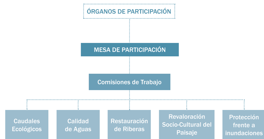
Órganos de participación del PRJ