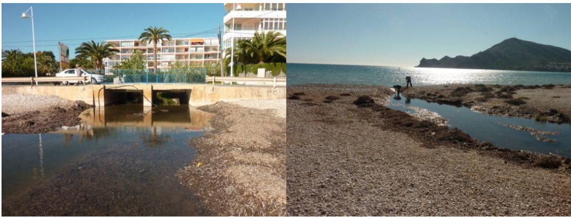
Desagüe del Barranc dels Arcs bajo la carretera CV-765. Limpieza de la desembocadura obturada por las gravas.