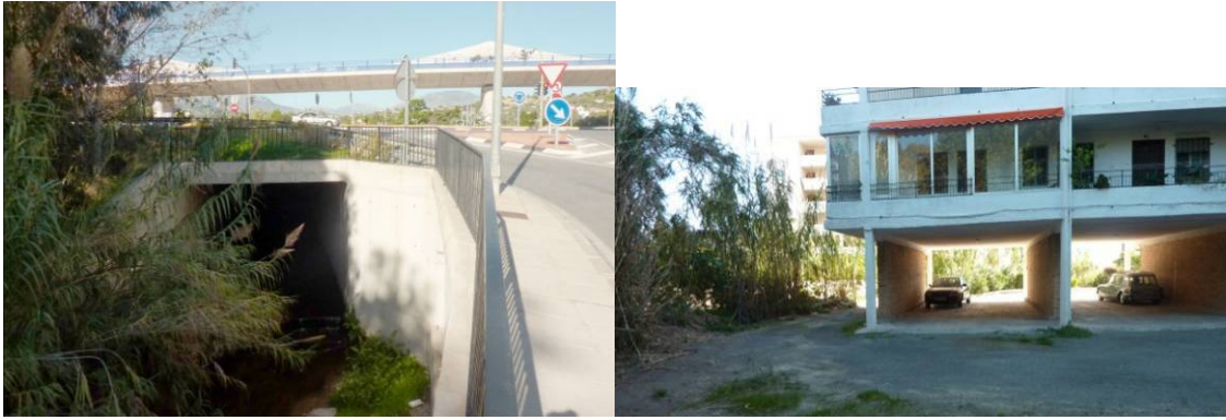
Edificio de apartamentos situado junto al barranco. A la derecha, vista desde la parte posterior del mismo con la planta baja exenta.