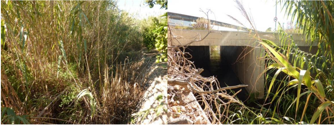
Cauce cegado por cañaverales inmediatamente antes de la rotonda del camí Vell d'Alacant.