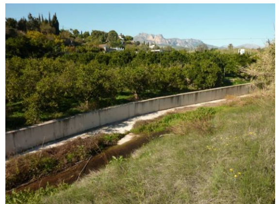
Tramo encauzado junto al Camí Vell d'Alacant, que discurre paralelo sobre un terraplén sobreelevado por la mara en la izquierda del barranco.