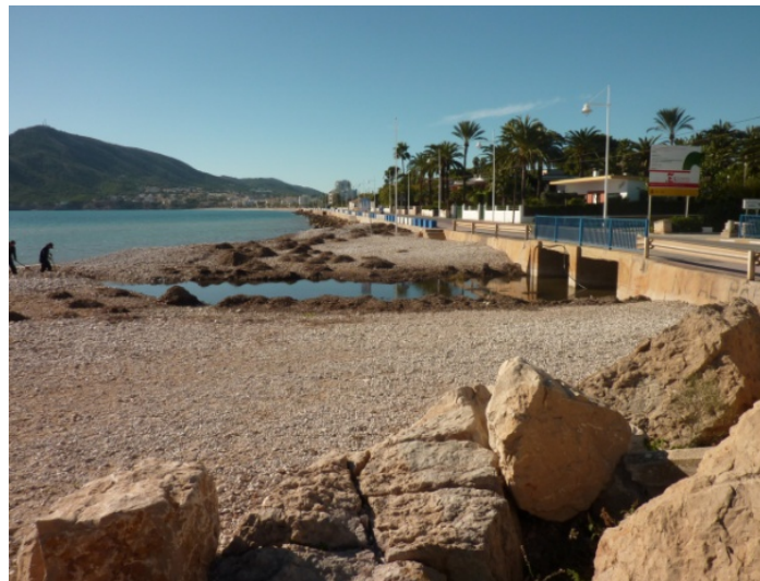
Desembocadura del Barranc dels Arcs, tramo de costa erosivo defendido con escollera al sur del espigón del puerto.