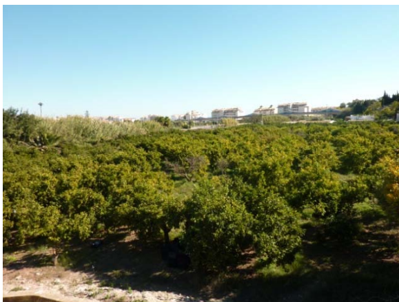
Vista de la vaguada de fondo plano recorrida por el barranco mirando hacia la costa.