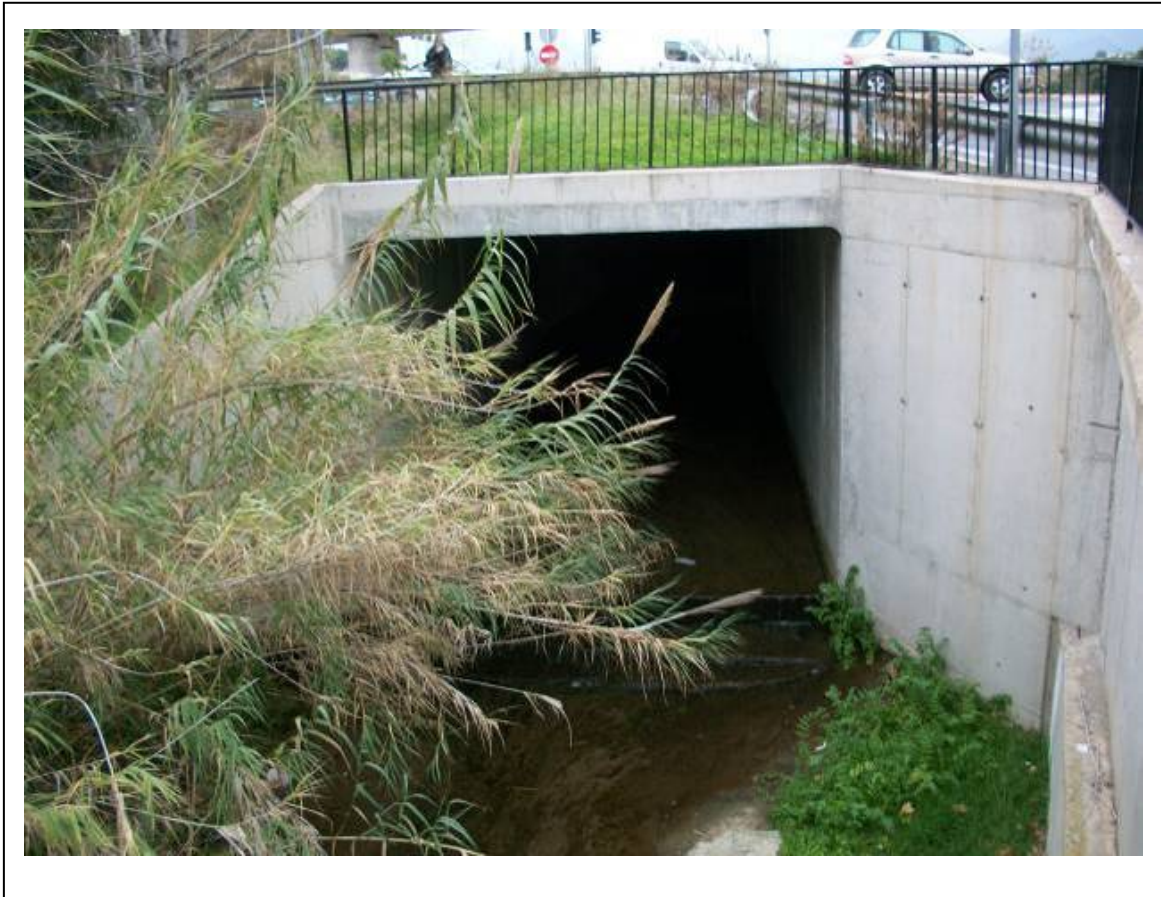
Paso actual del Barranc d'els Arcs en la rotonda de la N-332. (ALT-202)

Posteriormente El cauce del barranco, en su margen derecha está formado por muro de piedra en estado semiderruido y arbolado de gran porte constituido por eucaliptos y pinos de altura. En su margen izquierda se encuentra el muro de contención de la calle S/ Francisco.