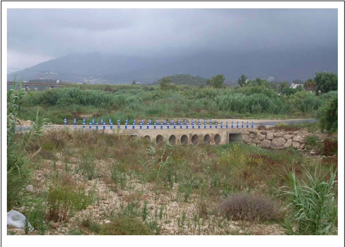
Paso ALT-104, badén de paso en camino local de acceso a depuradora. Se trata de un badén inundable

La pendiente del cauce y la competencia de la corriente permiten la transmisión de la carga gruesa hasta la desembocadura, quedando los bloques de mayor tamaño, de dimensiones superiores a 20-30 cm, depositados a lo largo de las barras y como carga de fondo de cauce.