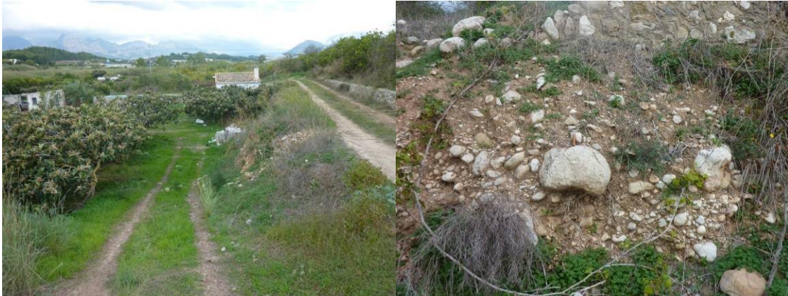
Nivel de terraza baja (T1) a la izquierda de la imagen, que aparece a lo largo de la margen izquierda. A la derecha, detalle de los depósitos de la terraza baja, que incluyen gravas, cantos y bloques calizos bien rodados con abundante matriz limoarenosa.