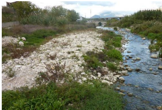
Barra lateral de bloques y gravas aguas abajo del puente de la autopista A-7.

La pendiente del cauce y la competencia de la corriente permiten la transmisión de la carga gruesa hasta la desembocadura, quedando los bloques de mayor tamaño, de dimensiones superiores a 20-30 cm, depositados a lo largo de las barras y como carga de fondo de cauce. En su desembocadura el cauce natural se abre formando un abanico deltaico, con la mayor parte de su superficie sumergida bajo el mar como ponen de manifiesto los estudios de la plataforma marina.