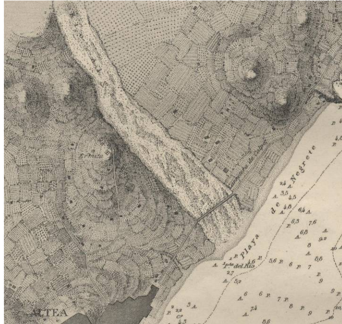
Tramo final del río Algar en 1879, representado como un cauce braided con barras de grava longitudinales. Obsérvese que la elevación del tramo final de la margen derecha actualmente no existe al estar una cantera en explotación