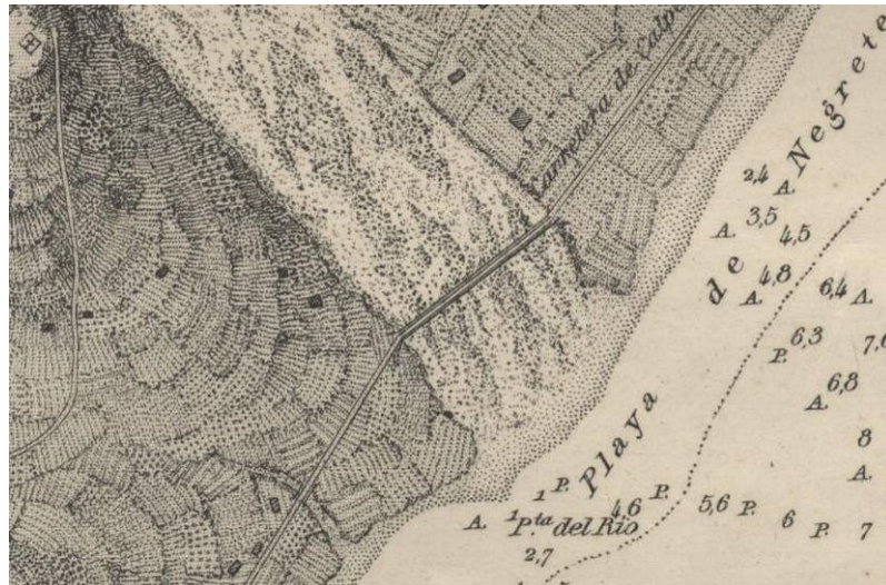
Detalle de la desembocadura del río Algar en la carta náutica de 1879. Representa la Punta del Río y, al sur, la gola del Barranquet.