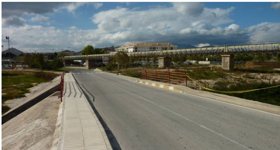
. El paso de la carretera sobre el río Algar, tras el puente de ferrocarril de vía estrecha, forma una pequeña represa en el cauce, Altea al fondo.