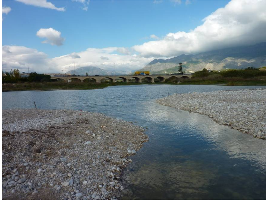
Vista desde la barra de desembocadura.