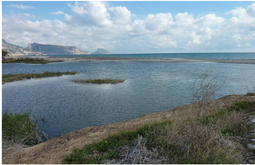
Desembocadura del Riu de l'Algar con barra de cierre de cantos y gravas.

por la construcción de diferentes presas de derivación y el crecimiento de densos cañaverales en el lecho del río que fijan el sedimento de las barras. La dinámica fluvial del río Algar está afectada por diversos cambios recientes, la mayor parte desencadenados por la acción humana. En primer lugar, por la alteración del régimen fluvial (menor frecuencia de crecidas) tras la construcción del embalse de Guadalest y, secundariamente, por diversas actuaciones directas en el cauce, como la construcción de defensas en las márgenes en diversos tramos (paso de la autopista A-7) y pequeñas presas para bombeo de agua. Otro cambio bien llamativo, en parte consecuencia de lo anterior, es la completa invasión del lecho del río por densos cañaverales de Arundo donax aguas abajo de la presa de Mandem.