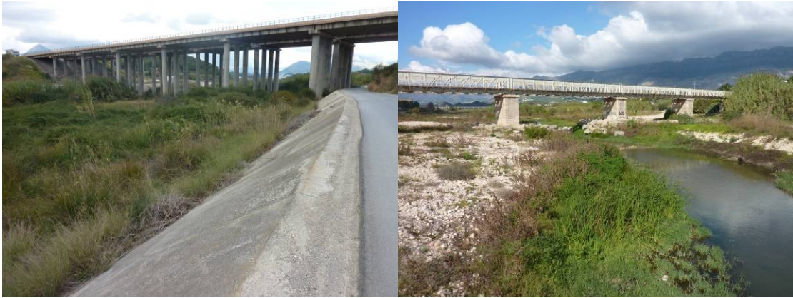
Defensas laterales de las márgenes a la altura del puente de a autopista A-7