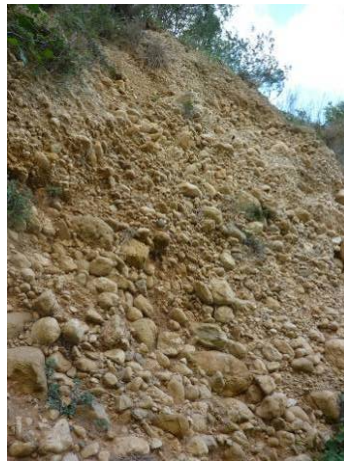
Terraza media con gravas, cantos y bloques rodados cementados. Visible a lo largo de la margen derecha del río.