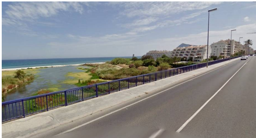
Desembocadura del Riu de l'Algar desde el puente de la carretera N-332. A la derecha urbanización sobre el área inundable.