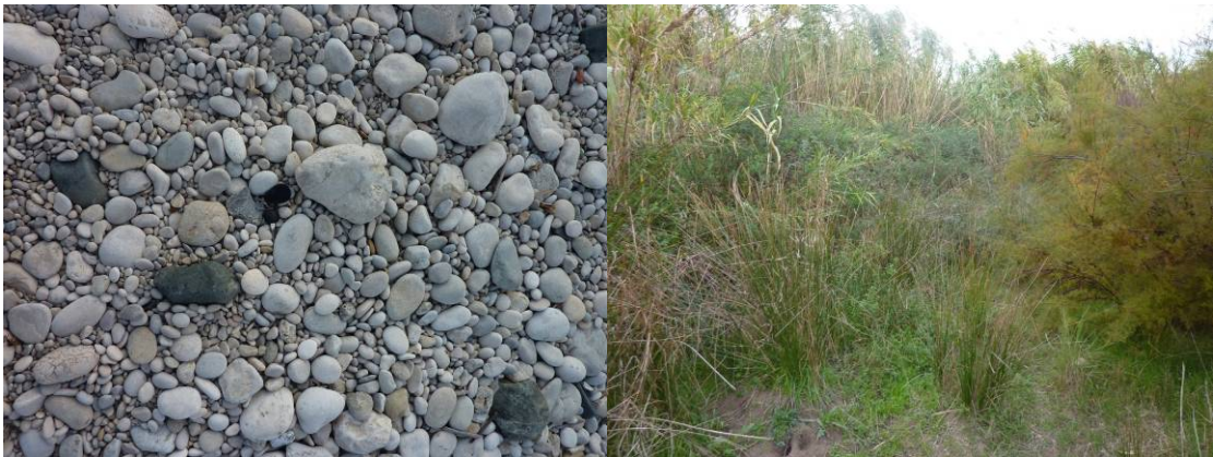
Detalle de los materiales de la barra de desembocadura, gravas rodadas con predominio de materiales calizos blanquecinos entre los que se intercalan algunas gravas oscuras de materiales ígneos (ofitas triásicas).